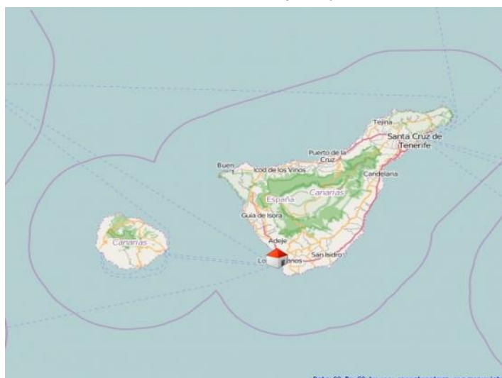
Playa de las Américas