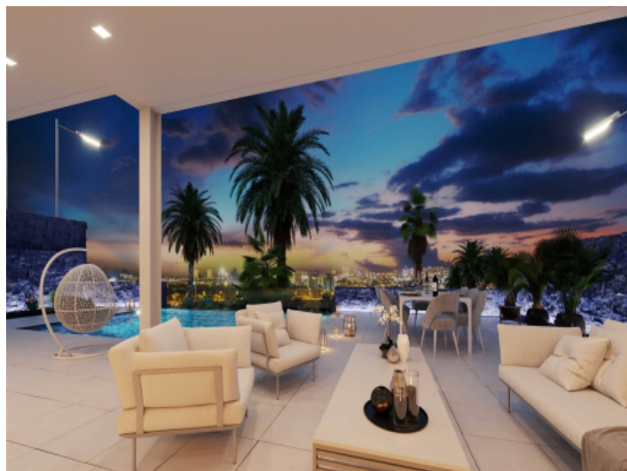
Covered terrace by the pool