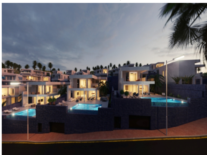
Exterior view of the villa