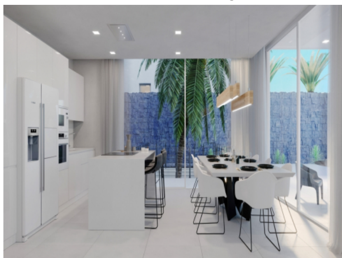
Kitchen and dining area