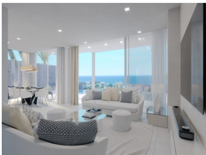
View of the living area