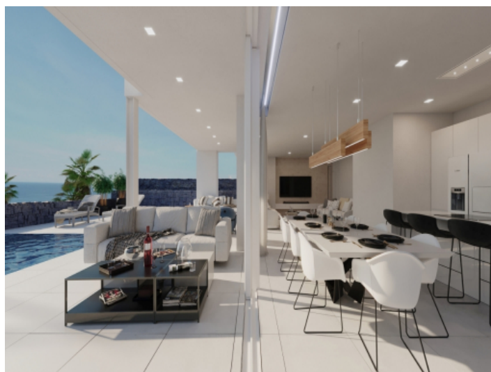
Covered terrace with dining area