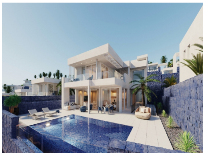
Exterior view of the villa