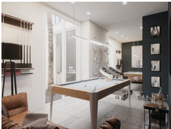
Office and hobby room