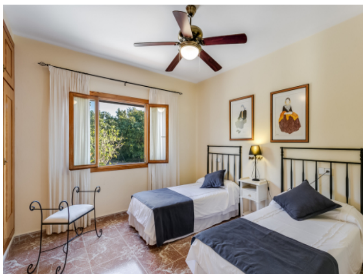
One of 4 bedrooms