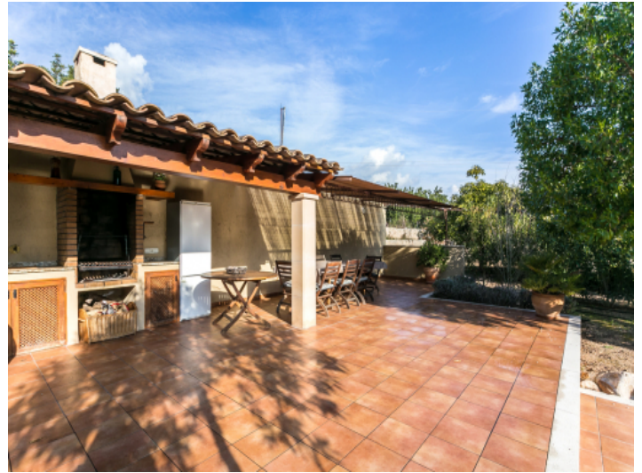
Barbecue area next to the pool