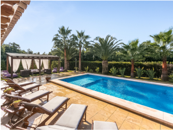
Spacious and sunny pool area