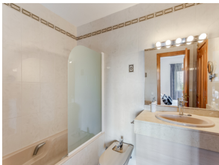
One of 3 bathrooms