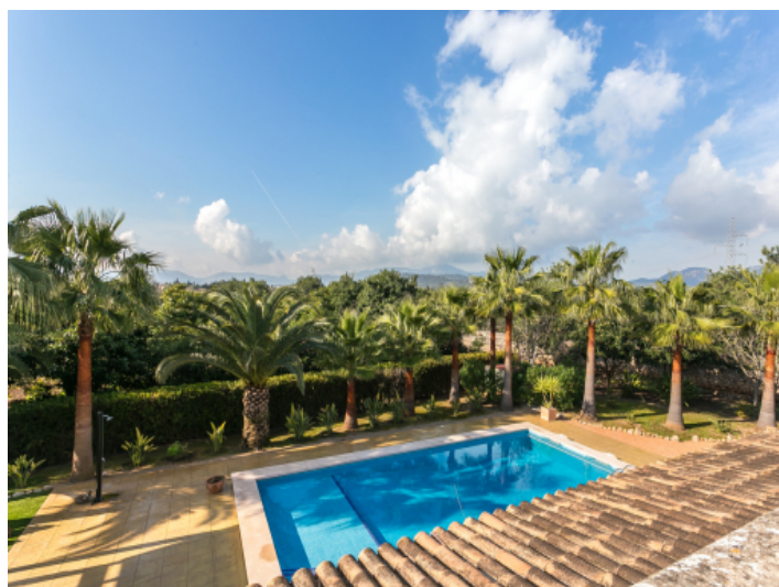
Magnificent mountain views