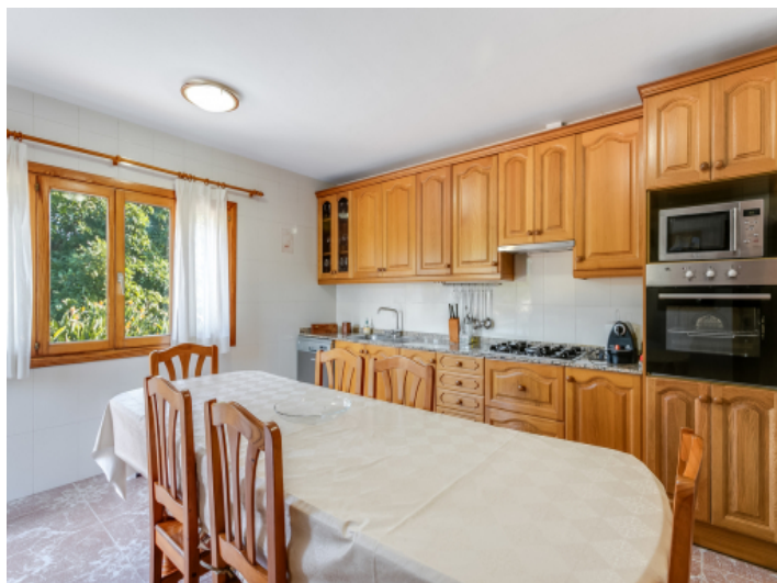
Further dining area in the kitchen