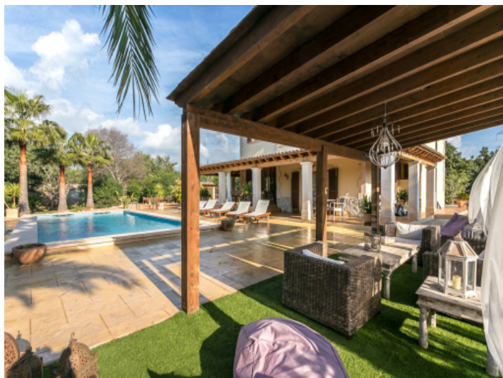
Cosy chill-out lounge at the pool area