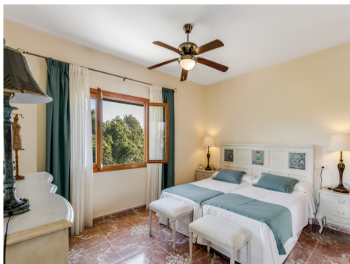
One of 4 bedrooms