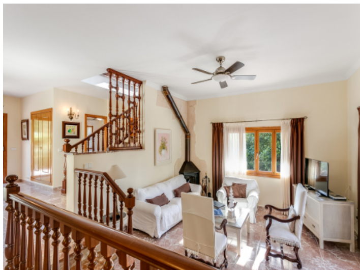
Charming living area with fireplace