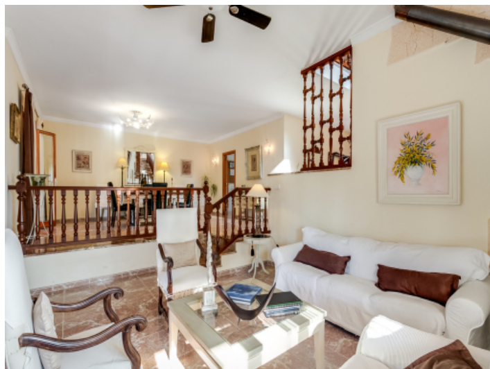
Bright living and dining area