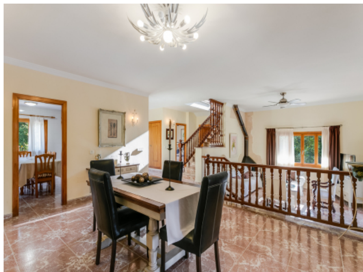
Open dining area