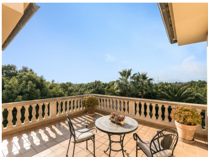
Lovely seating area on the upper terrace