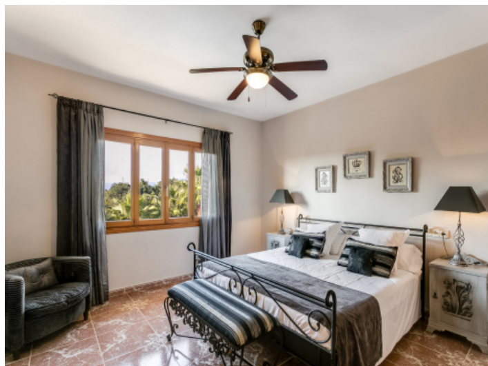
One of 4 bedrooms