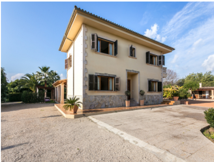
Exterior view of the beautiful finca