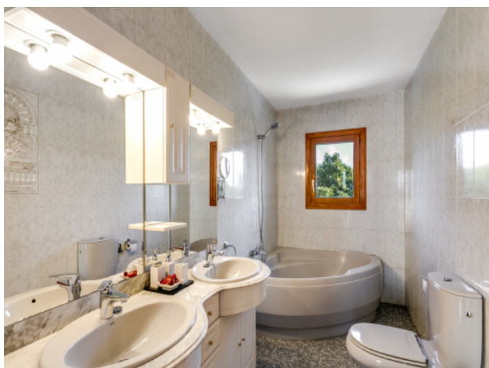
One of 3 bathrooms