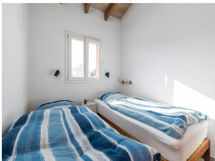
One of 4 bedrooms