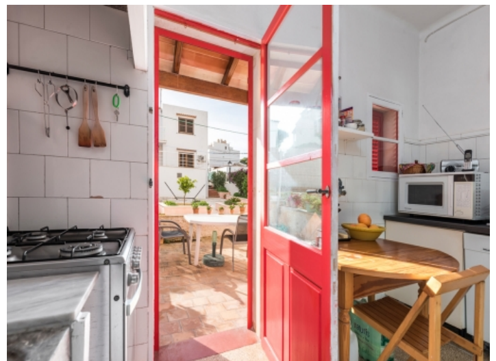
Access to the garden area