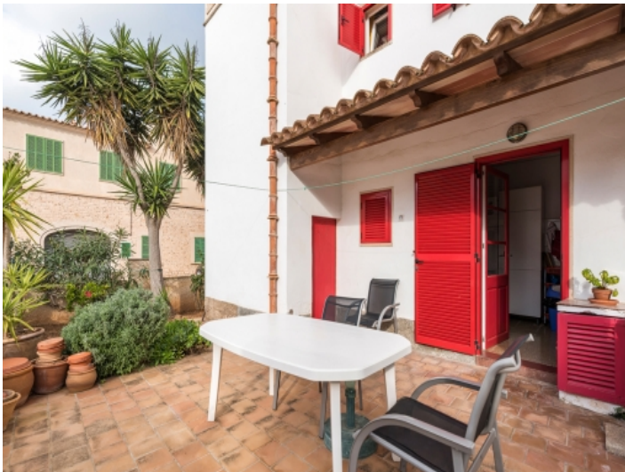
Terrace on the ground floor