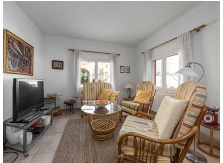
Bright living area