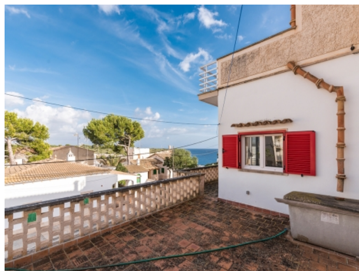
Sea view terrace in the first floor