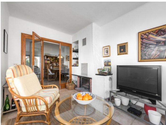
Living area with fireplace