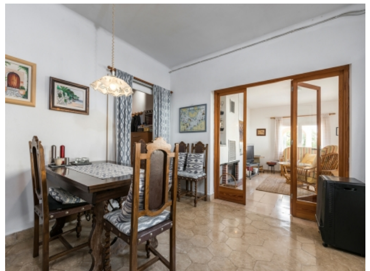
Adjoining dining area