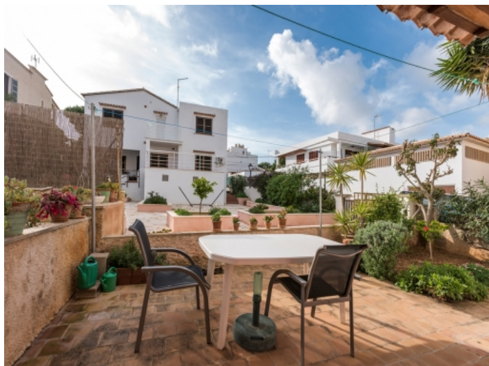
Terrace with small garden