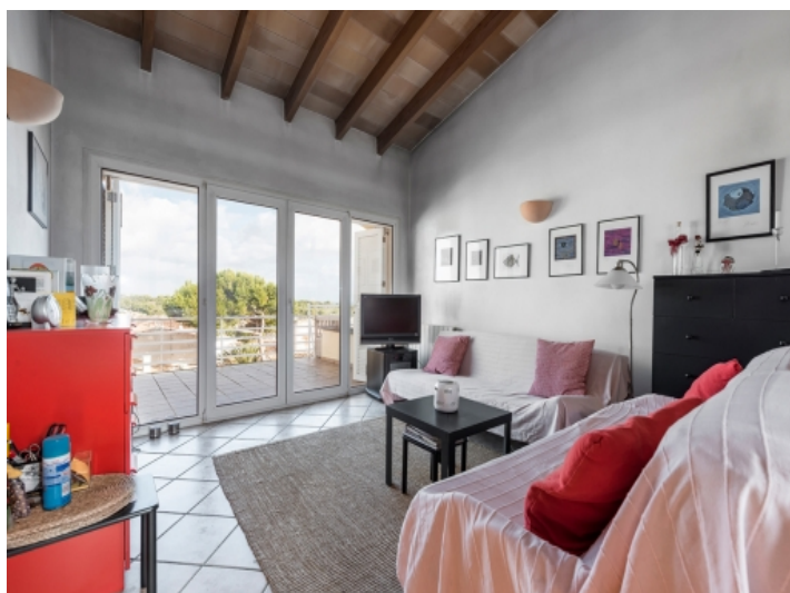
Studio with terrace in the attic