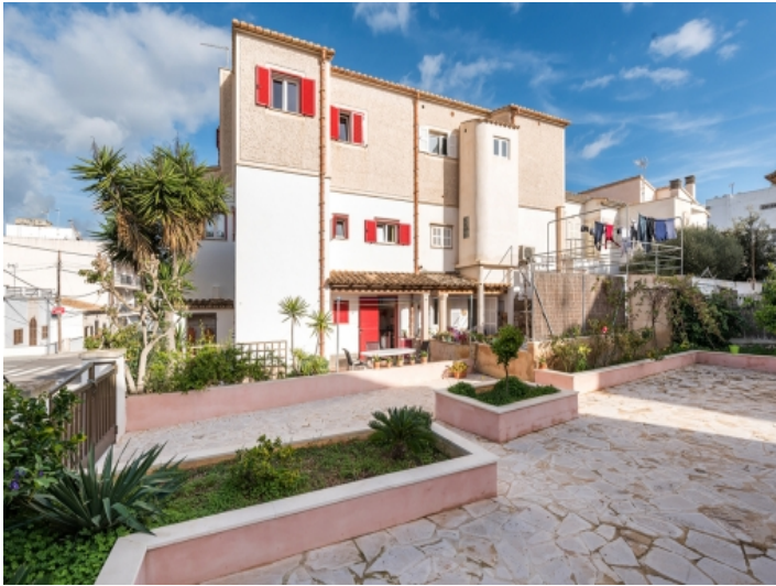
Exterior view of the house