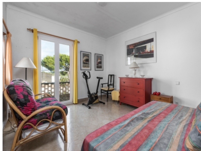
One of 4 bedrooms