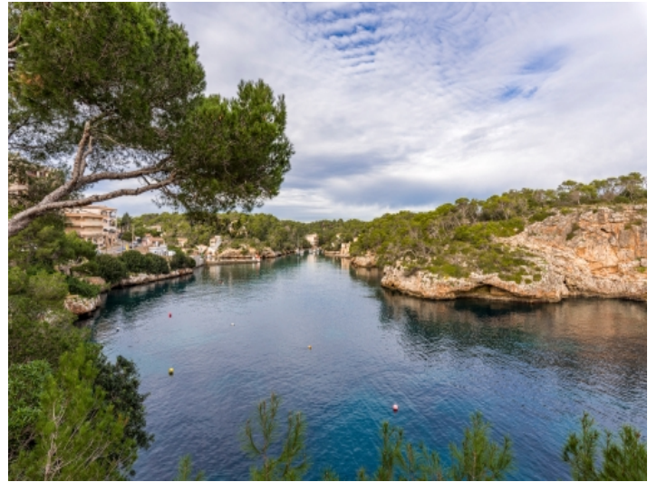
View to the bay