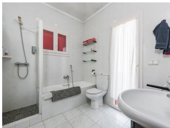
One of 2 bathrooms