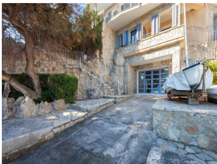
Private boat garage