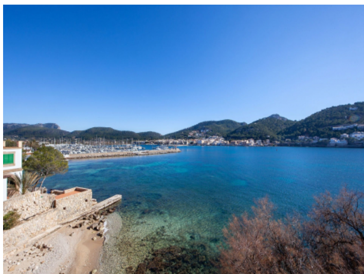
Panorama sea views