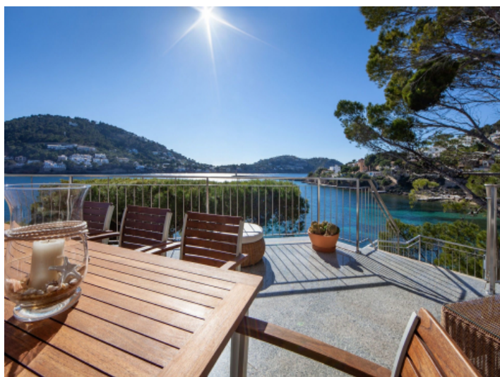
Stunning sea view terrace in first sea line