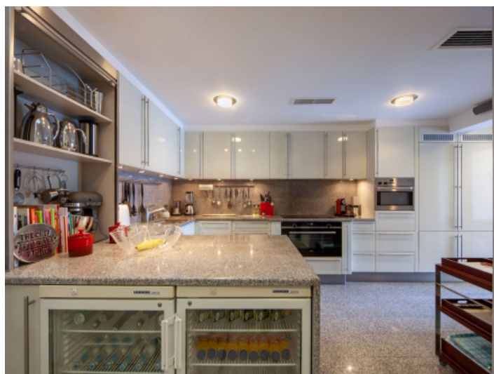
Very large kitchen