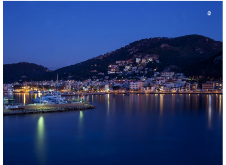
Port Andratx by night