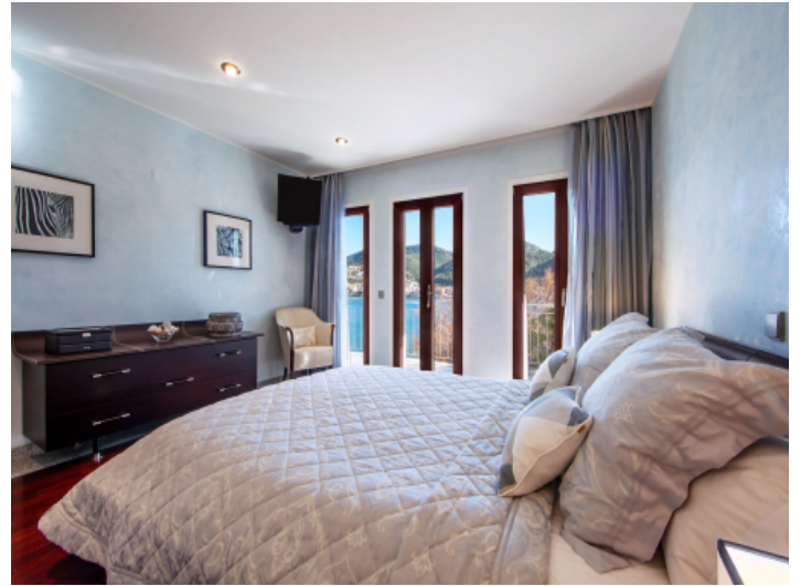
One of 5 bedrooms