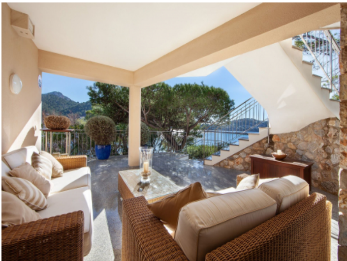
Covered sea view terrace