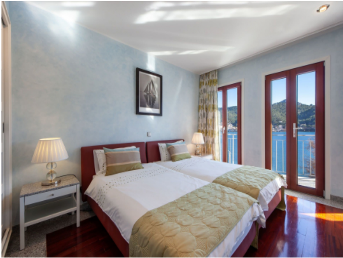
Dreamlike sea view bedroom