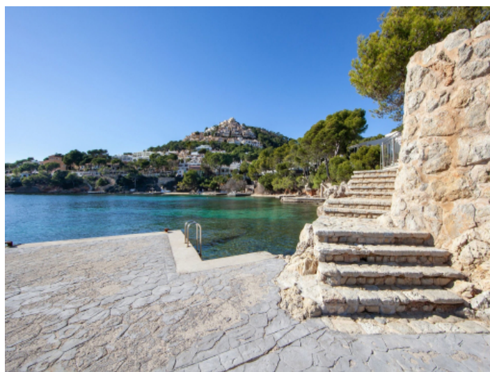
Private sea access