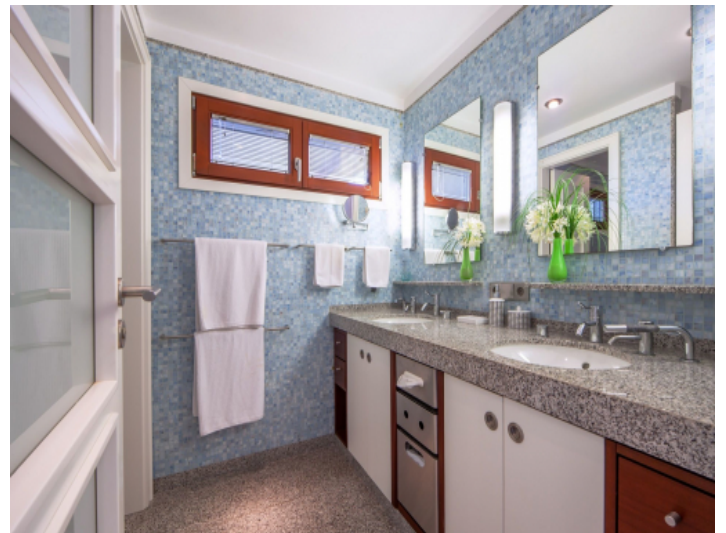
One of 6 bathrooms