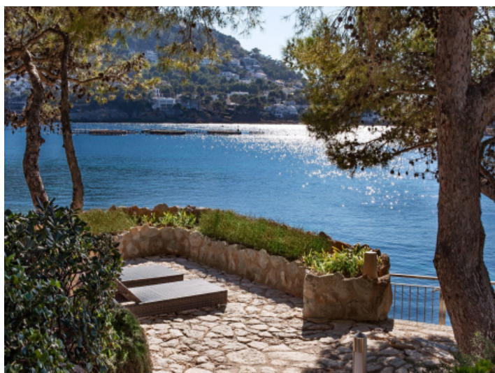
Unique sun terrace with sea access