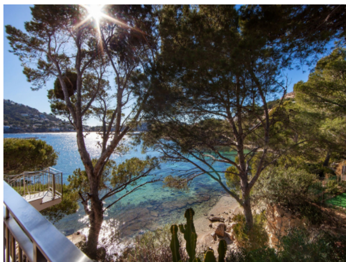
Dreamlike location directly at the sea