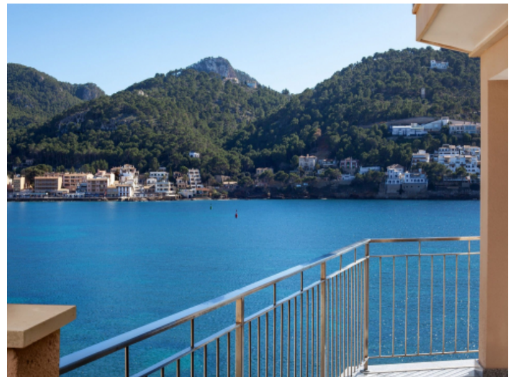
Stunning views over the bay of Port Andratx