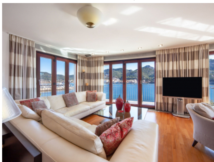
Generous living area with sea views