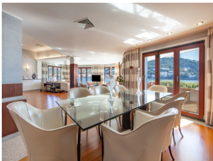
Open dining area with terrace access