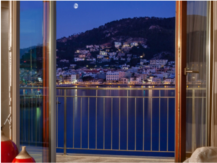
View by night