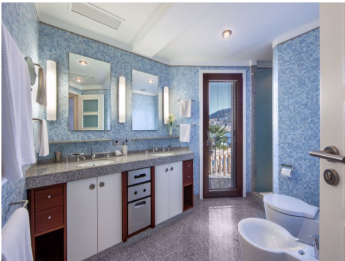
Bathroom with terrace access