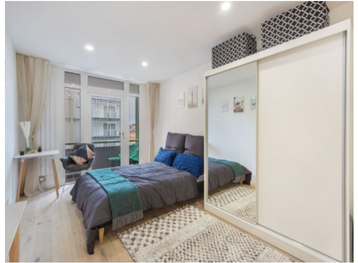
Open living area and bedroom with balcony