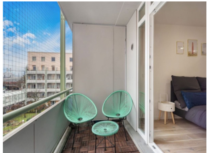
Balcony with court views