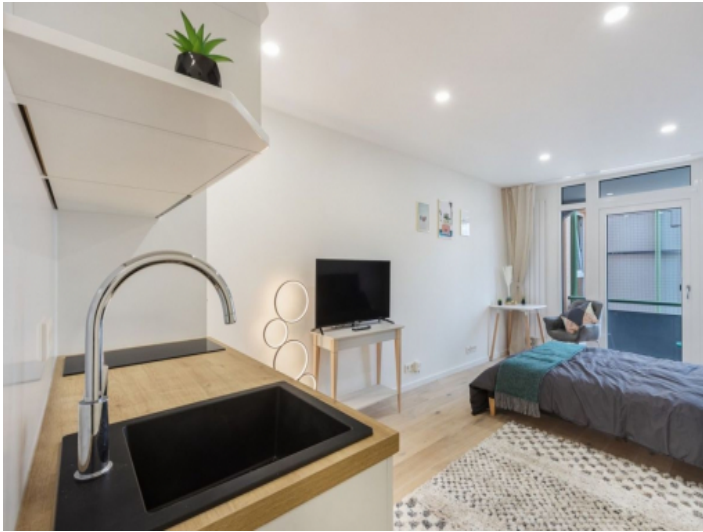
Open living area and bedroom