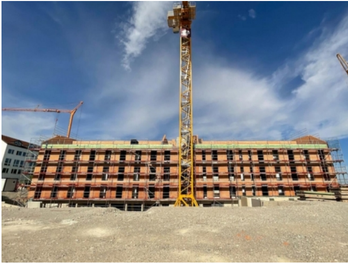
Gebäude im Bau