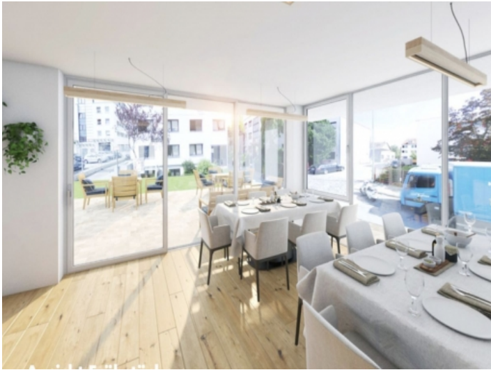
Light flooded community area