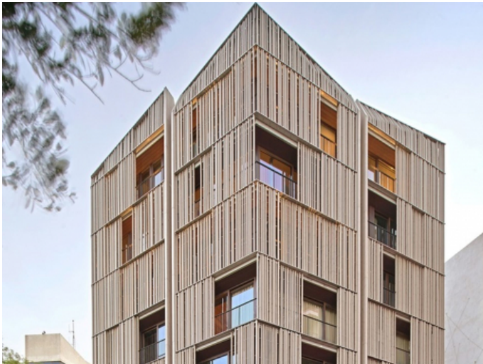
Exterior view of the residential complex