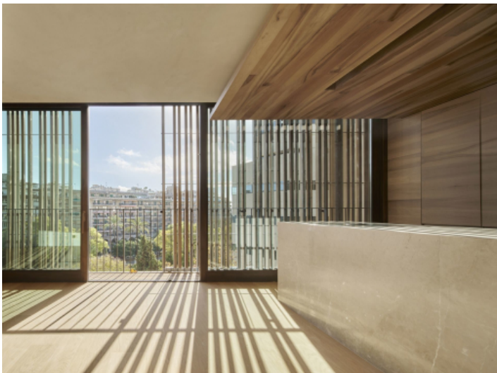
Dining area with a view