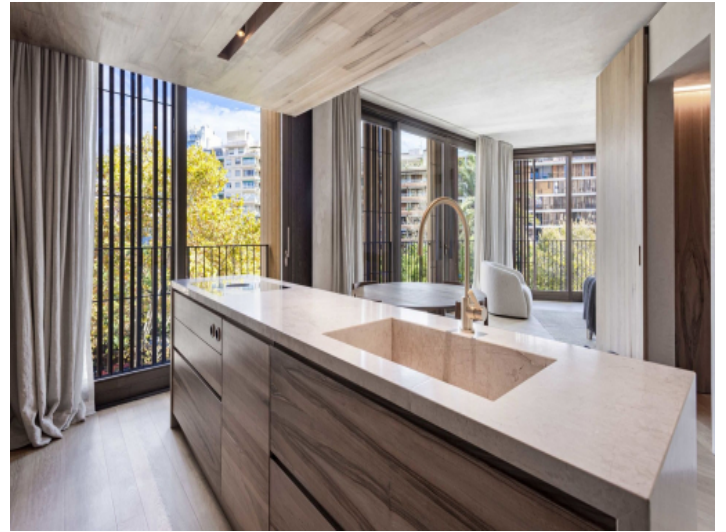
Open kitchen with cooking island