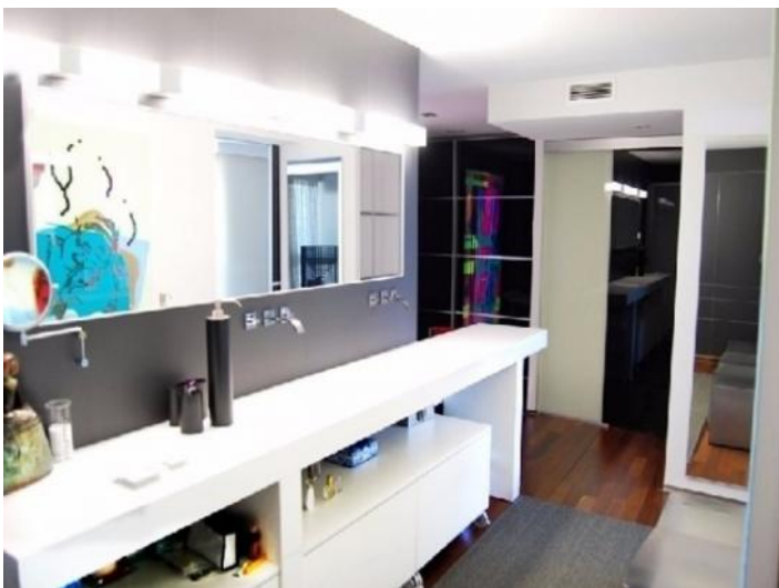
Eines der modernen Badezimmer mit exquisiten Interieur