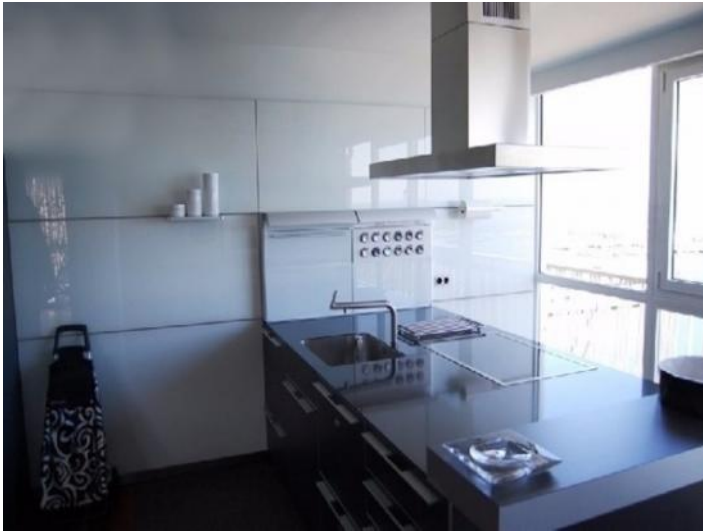
Die helle Küche mit Kücheninsel und bodentiefen Fenstern