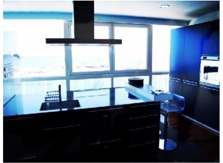
Die moderne Küche mit Kücheninsel und bodentiefen