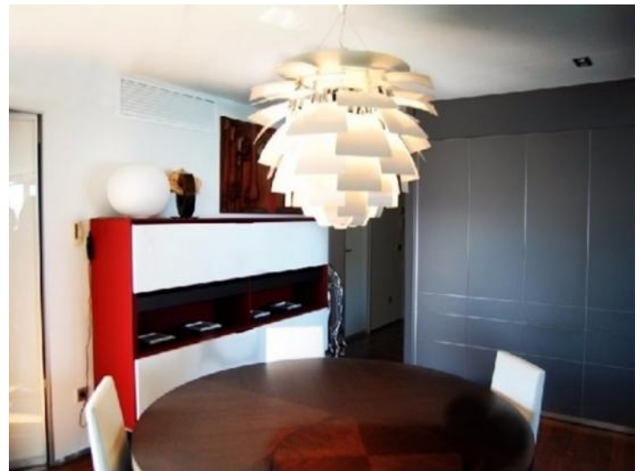
Der separate, helle Essbereich