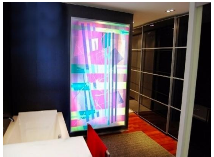
Eines der modernen Badezimmer mit exquisiten Interieur