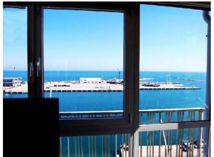
Der exklusive Ausblick auf den malerischen Hafen von Denia