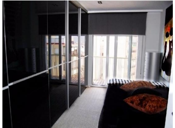
Eines der modernen, stilvoll eingerichteten Schlafzimmer