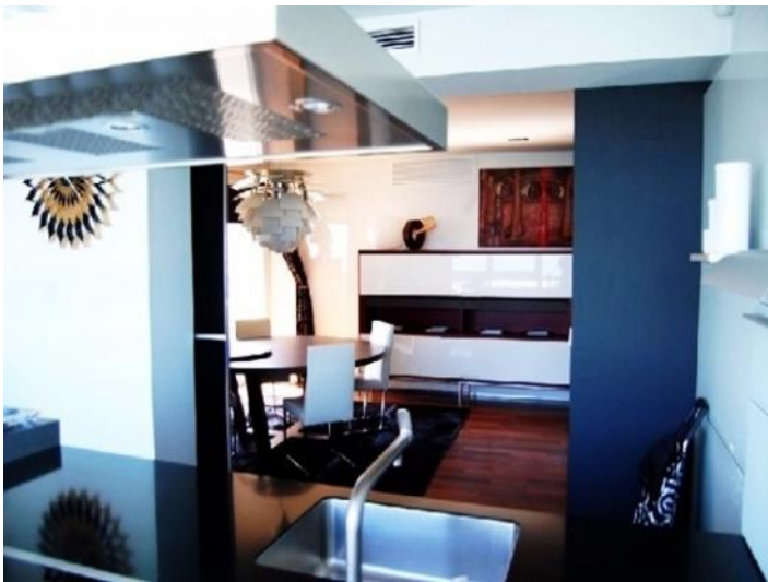
Die traumhafte Küche und der gemütliche Essbereich