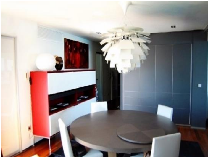
Der separate, helle Essbereich