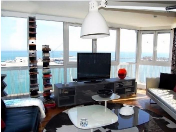
Der lichtdurchflutete Wohnbereich mit großartigem Ausblick