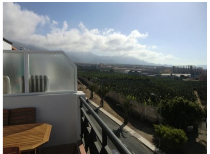
View of the roof terrace to the mountains