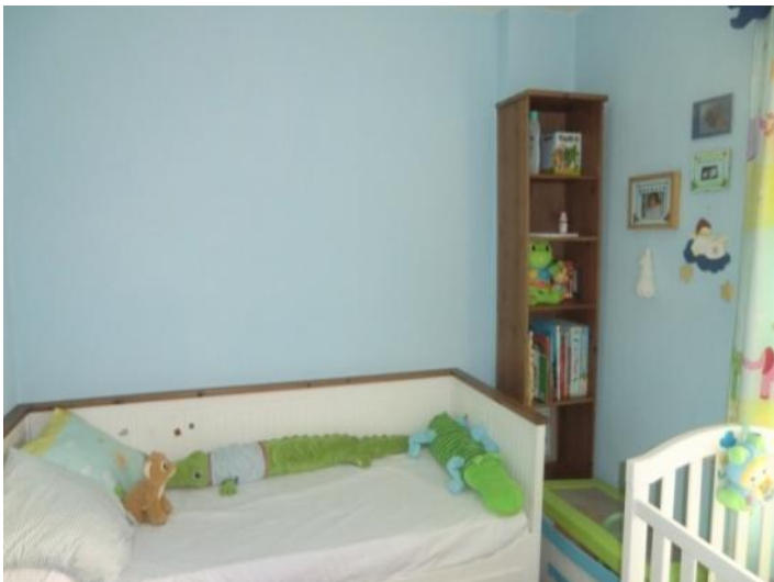
Another bedroom which is currently used as a nursery