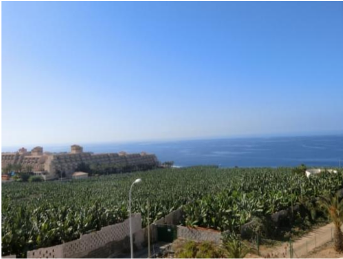
Fascinating sea view