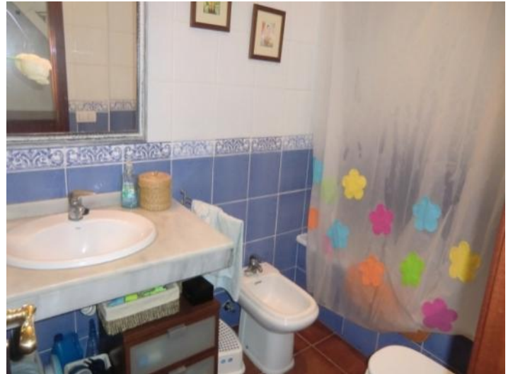
Beautifully tiled bathroom with bath tub