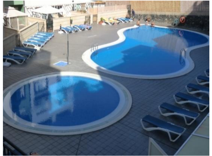
Large communal swimming pool offers plenty of space to