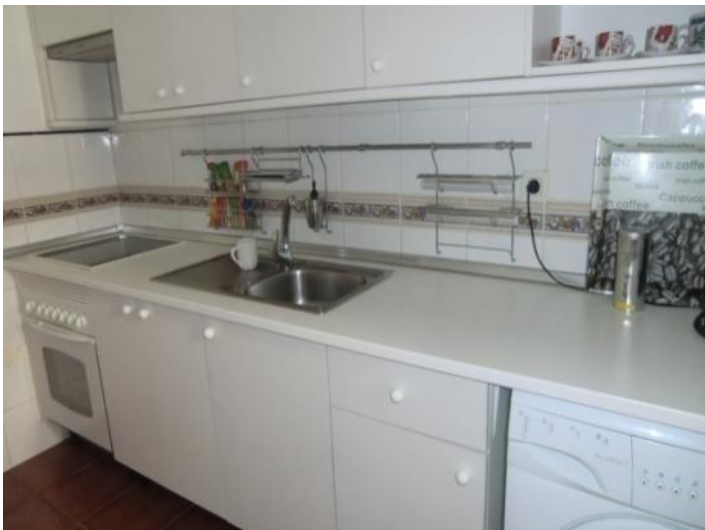
Bright and fully equipped kitchen