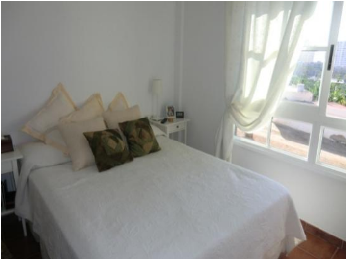
Friendly bedroom with large windows