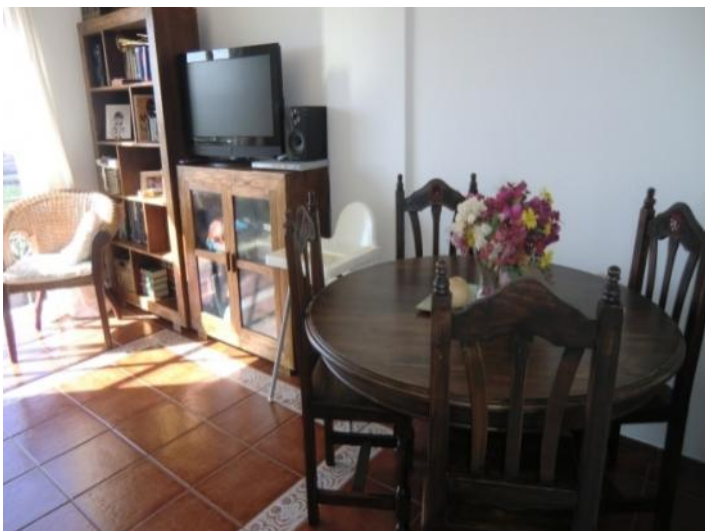
Living room with dining area