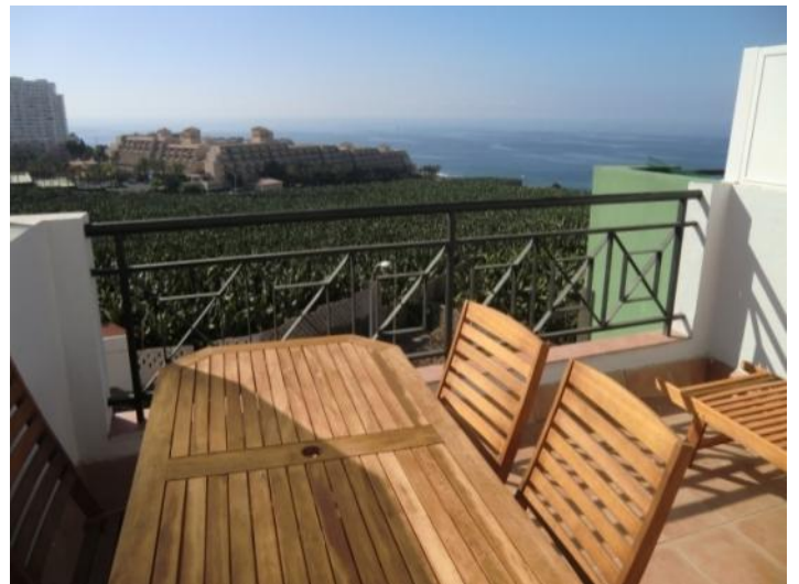
Terrace with wonderful view