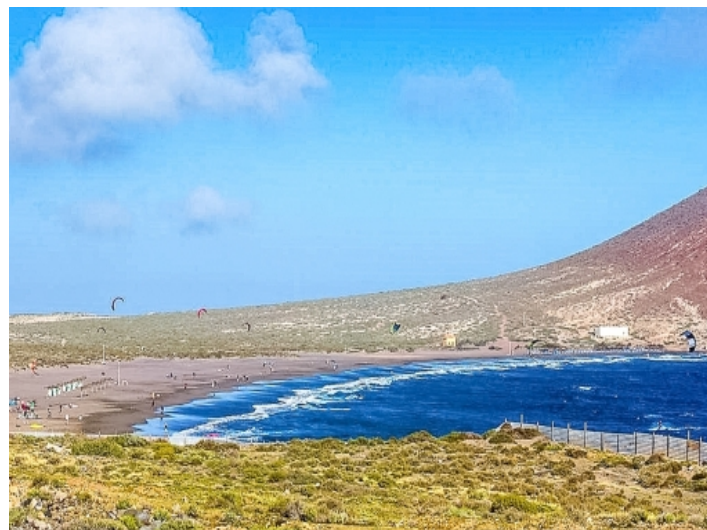
Der schöne Strand La Tejita