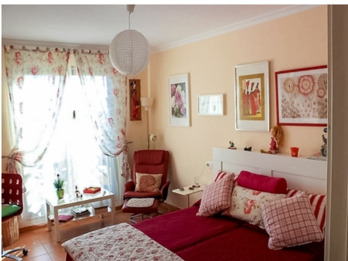
Das zweite Schlafzimmer