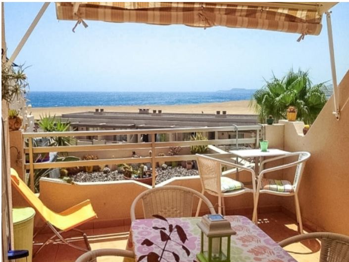
Herrliche Terrasse mit Strandblick