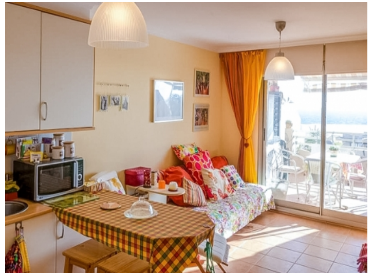
Heller Wohnbereich mit Terrassenzugang