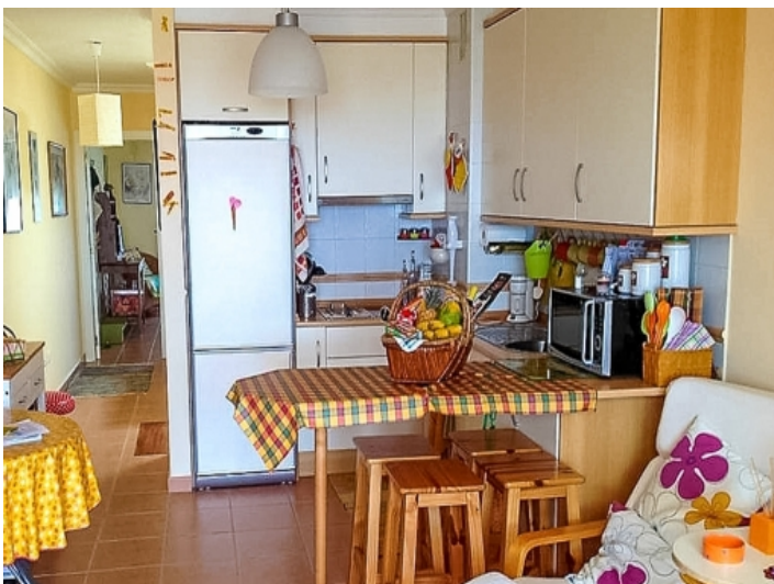
Blick zur offenen Küche