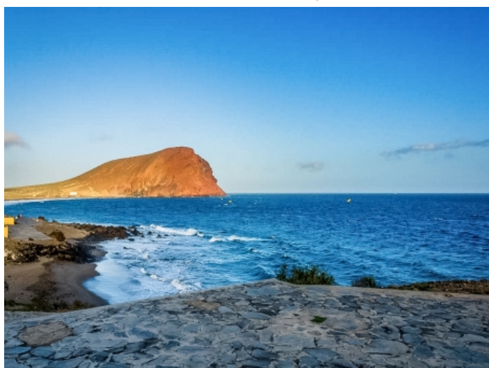
Die Wohnung befindet sich in erster Meereslinie