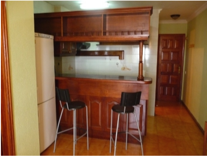
Open kitchen with bar