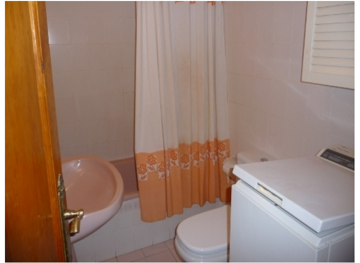
Bathroom with tub