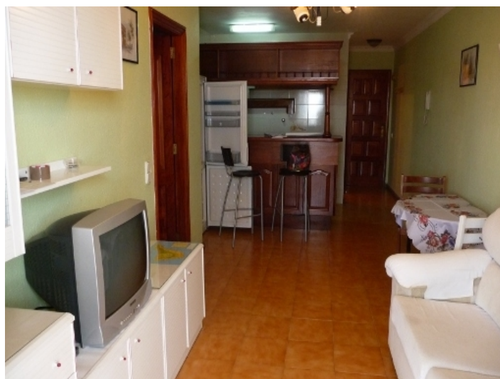
Living room with open kitchen