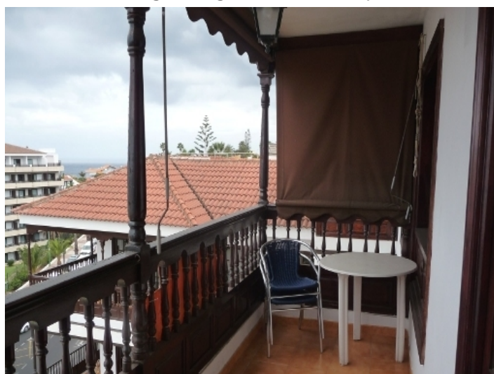
Balcony with afternoon sun