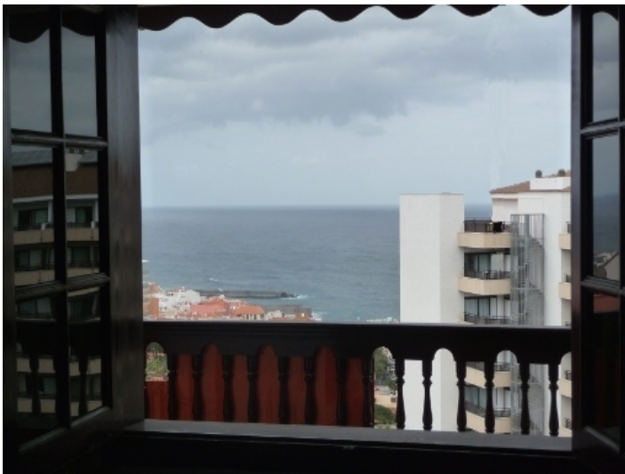
Sea view from the bedroom