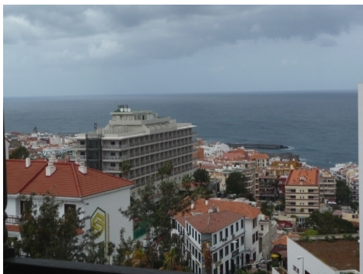
Sea view from the balcony