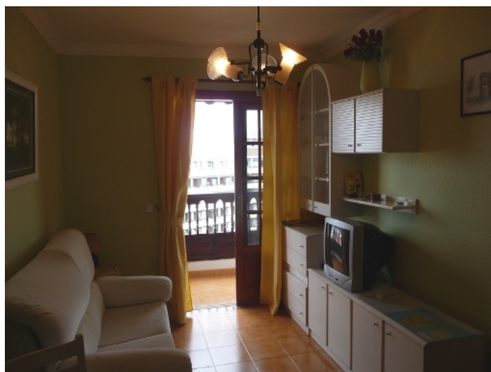
Bright living room with balcony