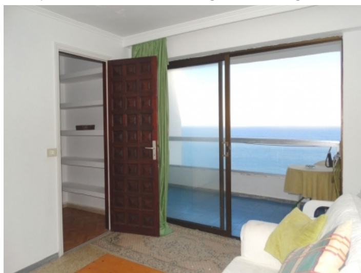
The exquisite third bedroom with sea views right from the