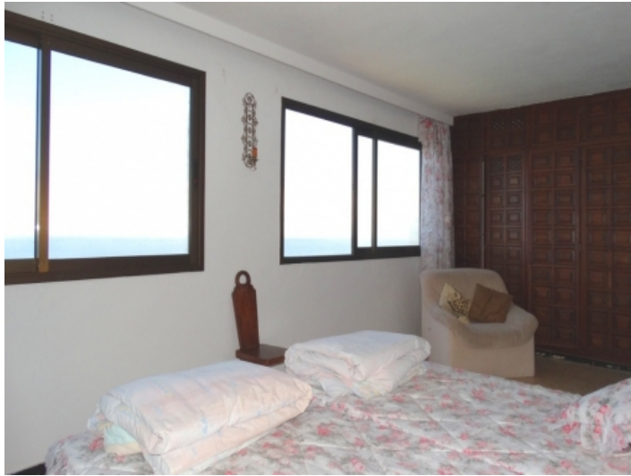
Beautiful Canarian cupboard in the bedroom