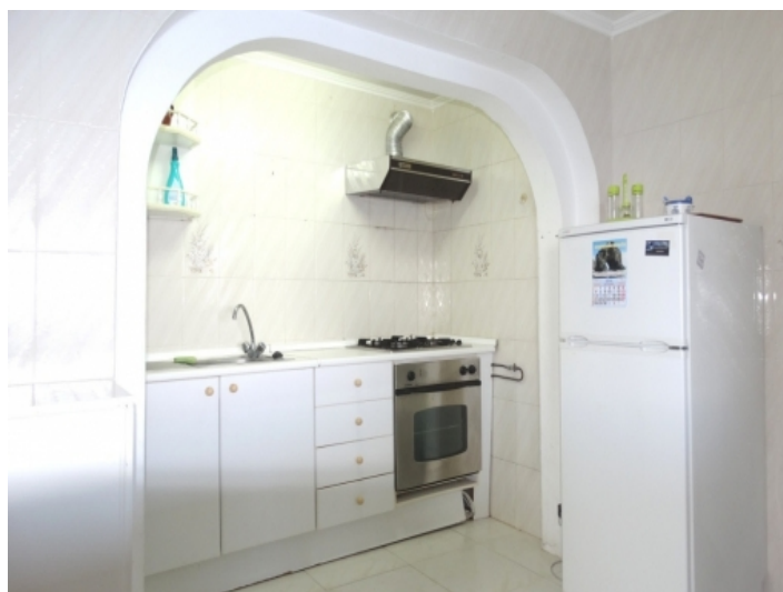
One half of the two-part kitchen