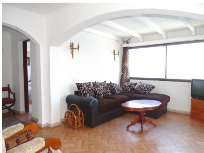
Large living room of the well-structured apartment