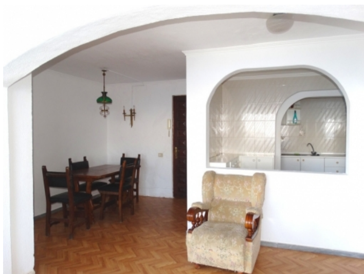
Kitchen and dining area in the apartment