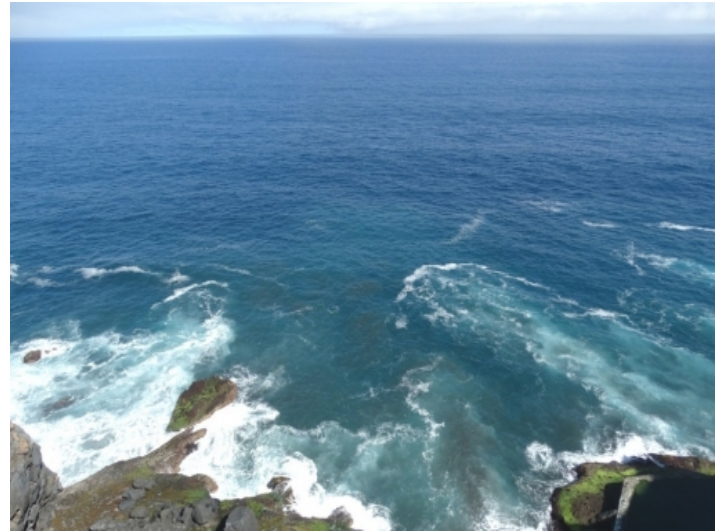
Sea view as it would be from the deck of a cruise ship