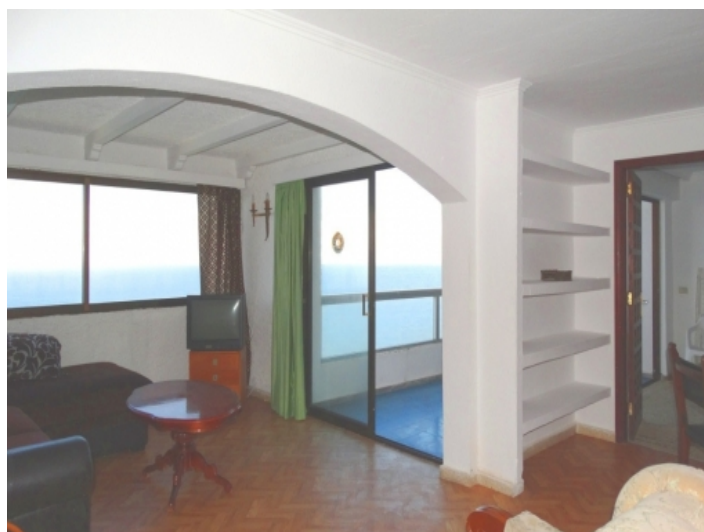
The spacious terrace communicating with the living room and