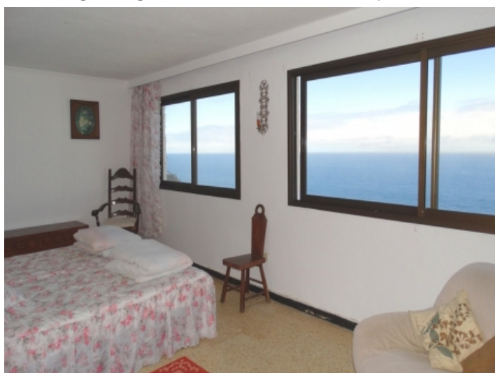
Plenty of space in the master bedroom