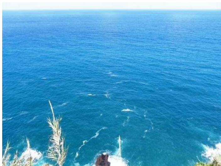
The premium view from the terrace