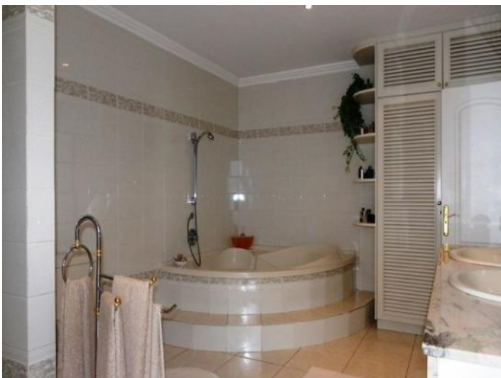
Plenty of room in the bath with round tub