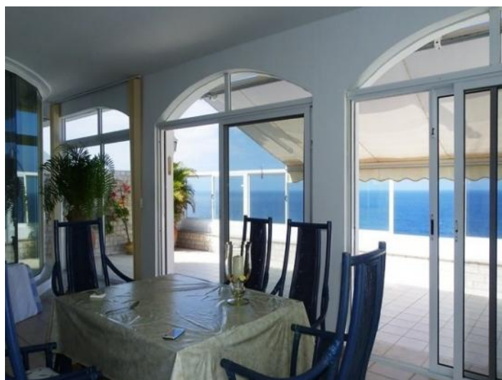
Dining-room and transition to the terrace with awning