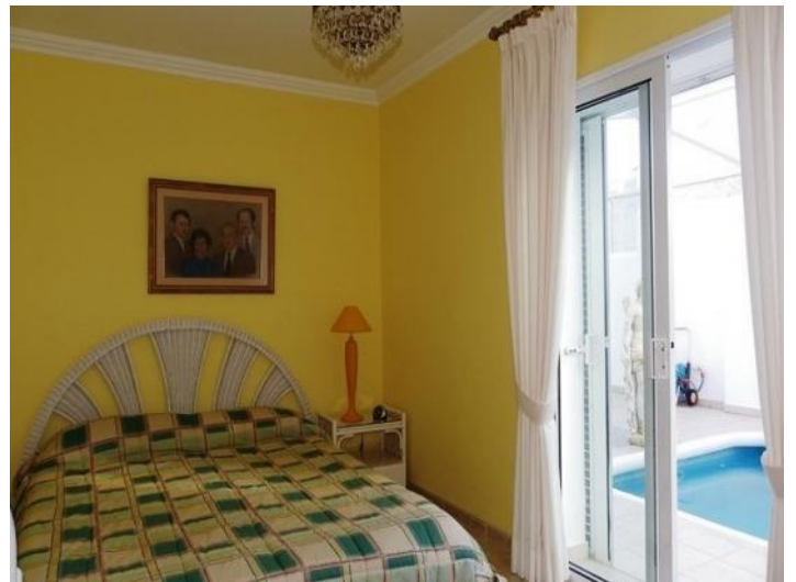
The second bedroom at the swimming pool