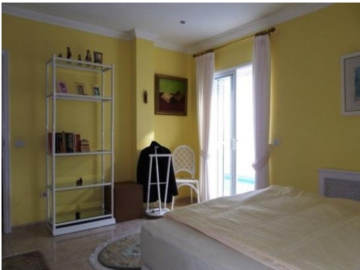
Another perspective of the bedroom