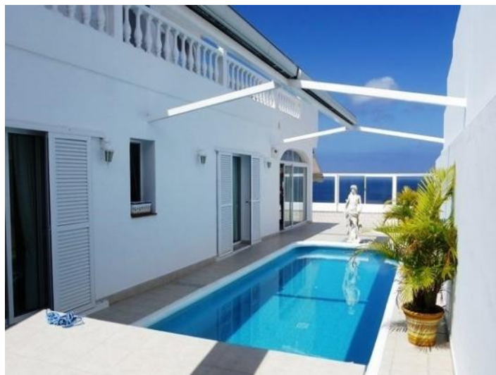
The sheltered swimming pool in the bedrooms