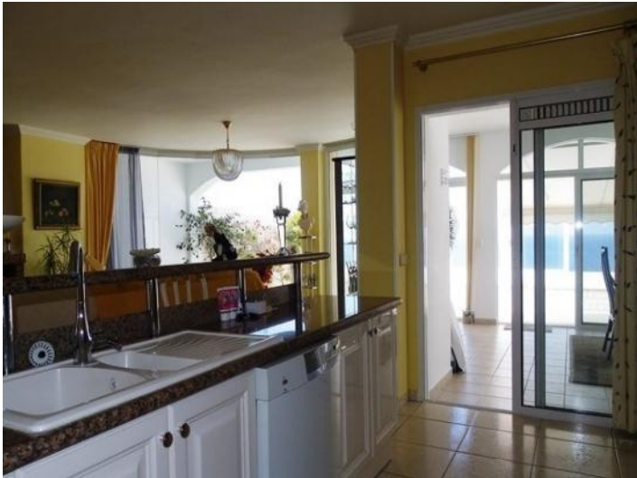
Much light, in the integrated kitchen of the living-room area