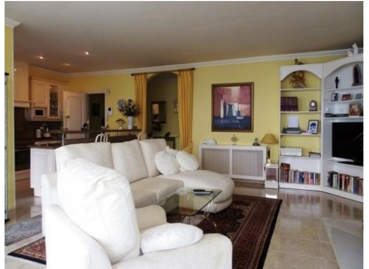
Plenty of light and warm colors