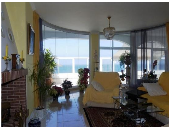
Exquisite Salon in round shapes