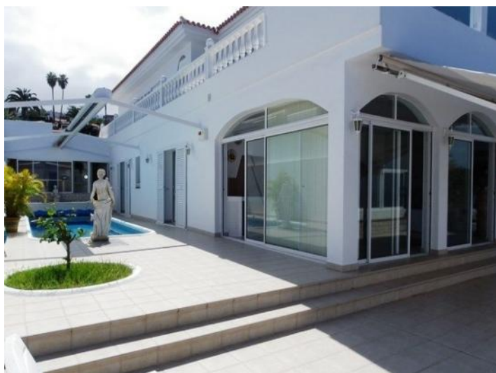
Design of the terrace corner