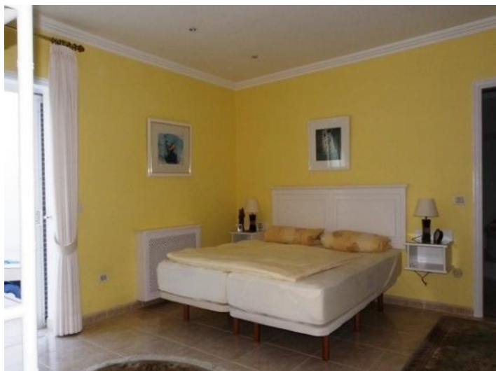
Master bedroom with access to the pool and Ensuite bad