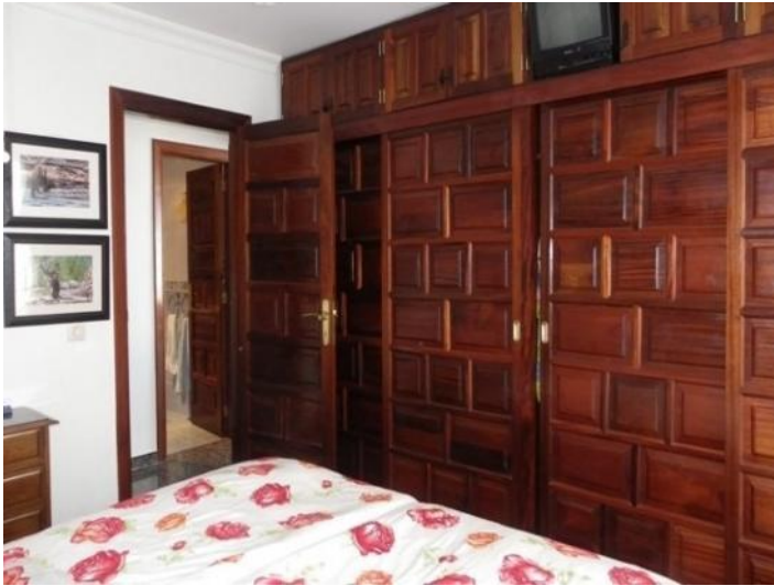
Plenty of space in the closet and TV in the master bedroom