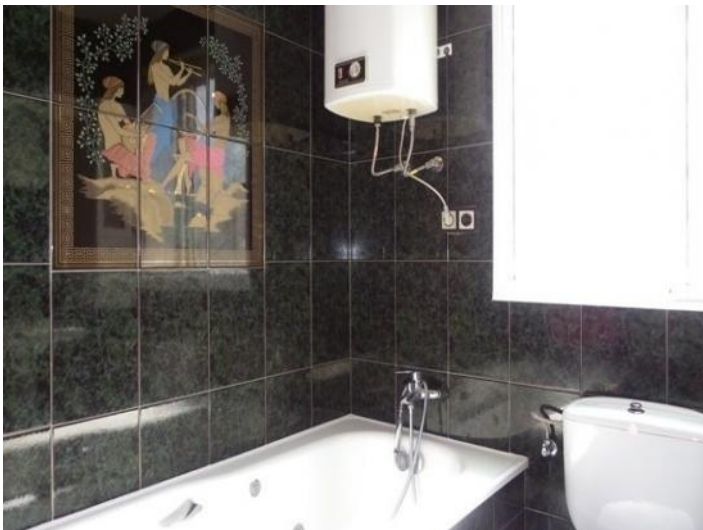
The second bathroom with bathtub