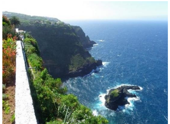
The romantic cliffs with Robinson Crusoe Island