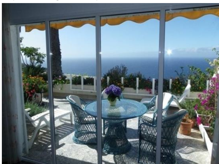
Terrace of 75 sqm subdividd in two areas