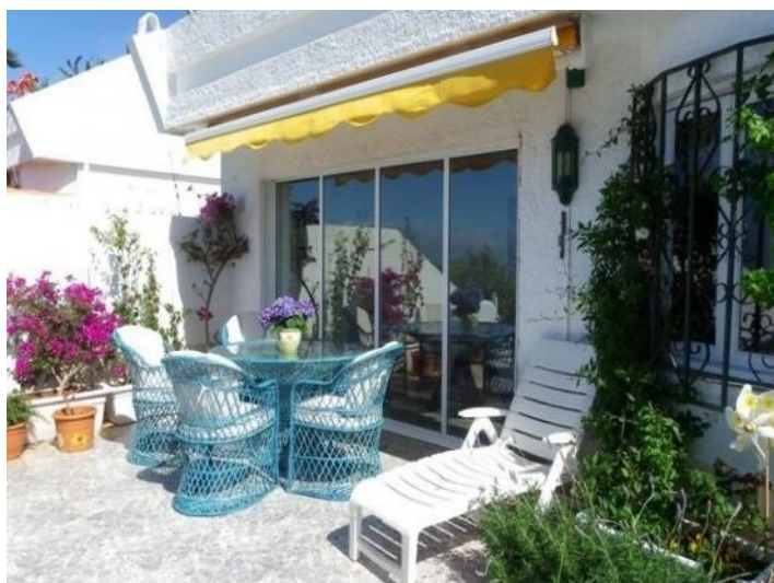
Protected seating area with awning right on the living room