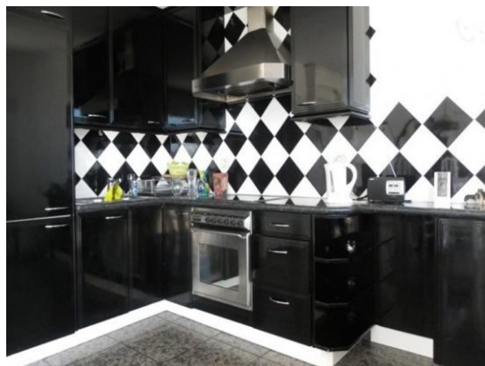
The modern kitchen with ceramic hob and extractor hood