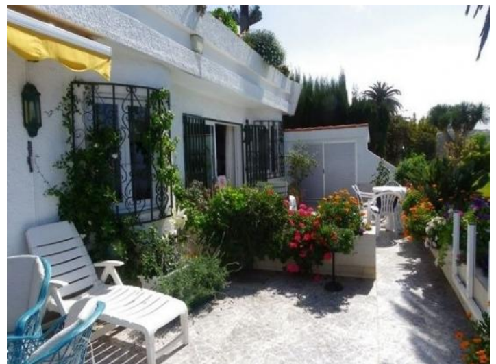
Majestic long terrace at the Community Garden