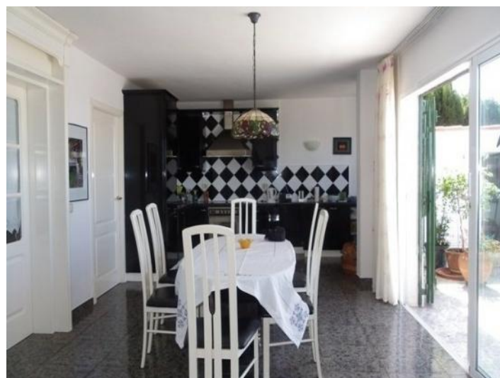
Separate dining area with stylish kitchen