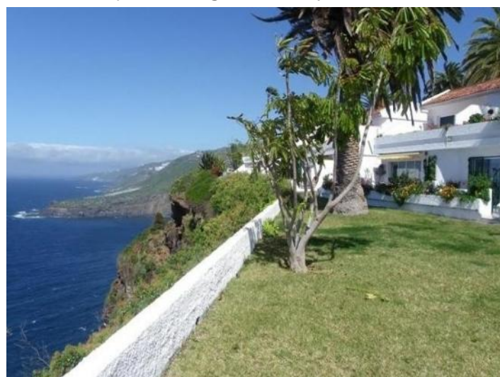
The well-kept garden right on the cliff