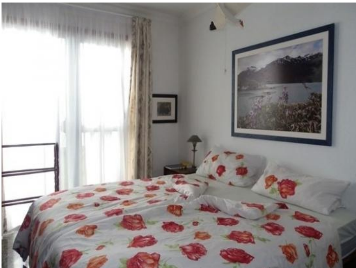
The bedroom has a bright ambience