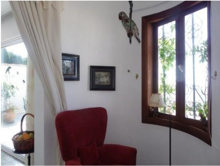
Cozy bay window at the salon