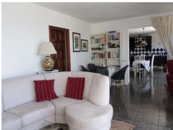
Spacious living area with panoramic sea views from the first