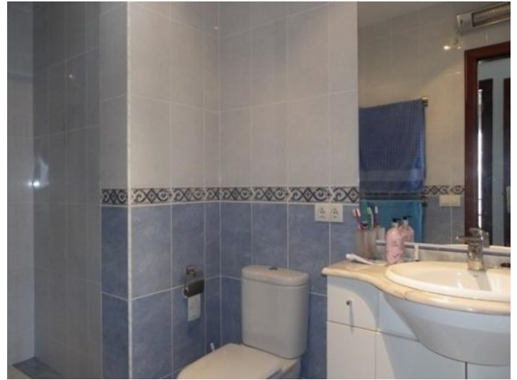
Bathroom with lots of space in the shower and large mirror