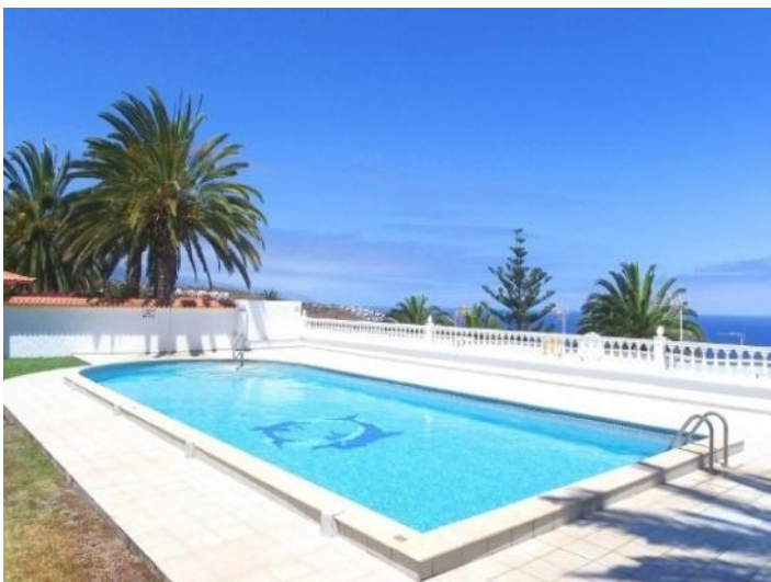
Large swimming pool with sea views to relax