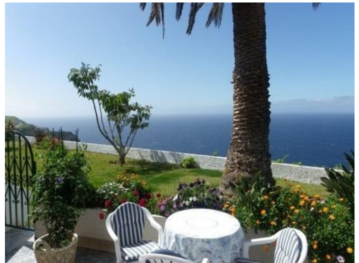
Wanderlust feeling with great Canarian palm