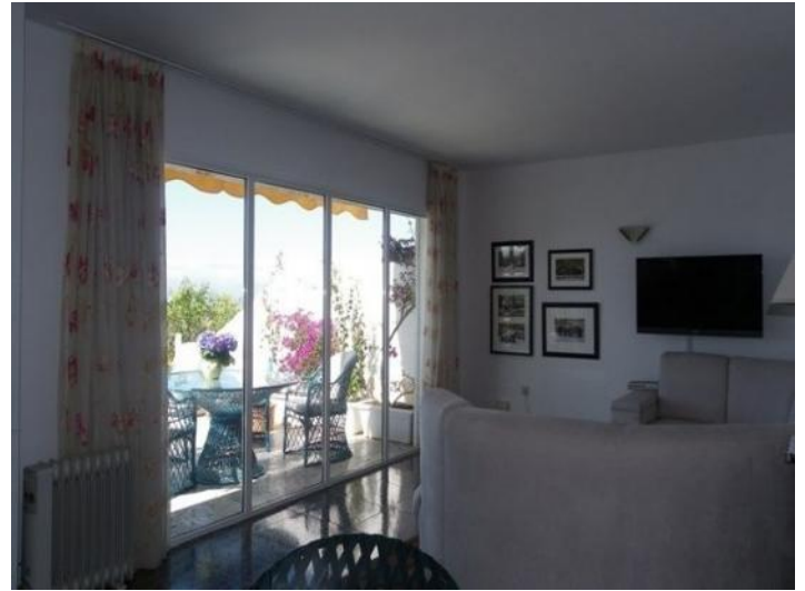
Bright living room with large sectional sofa in the front row