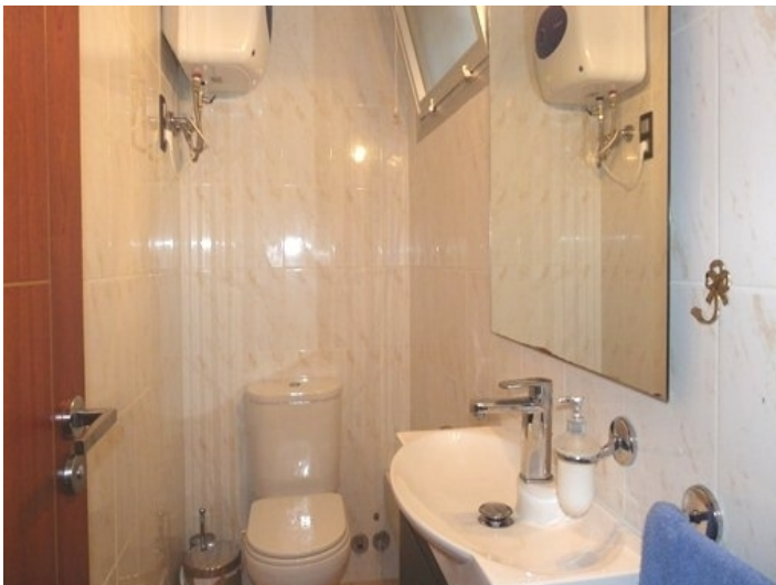
The guest bathroom