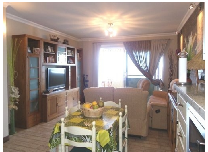
Alternative view of the living room