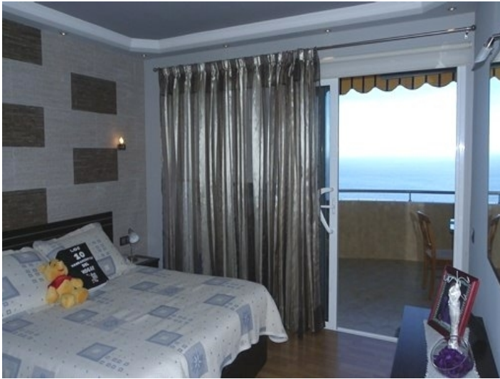
The master bedroom with ocean view and balcony access