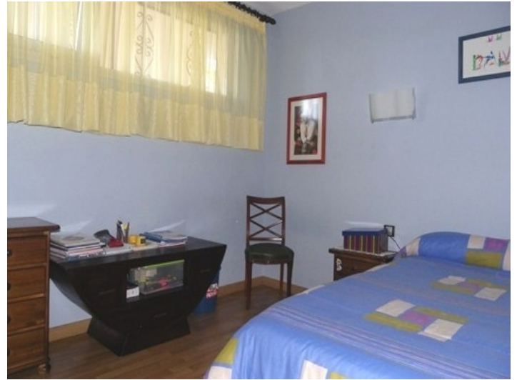
The second bedroom