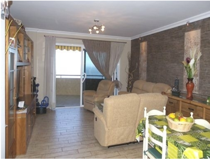
The living room with dining area and access to the terrace