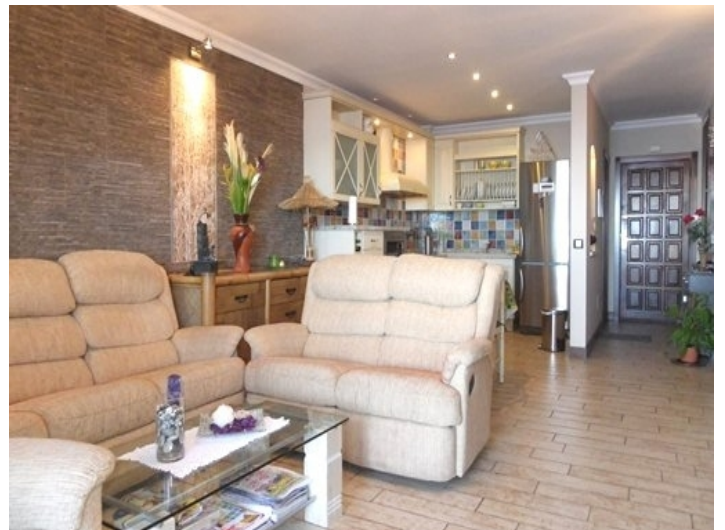
The living room with view to the kitchen