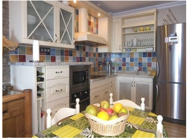
The open, fully equipped kitchen