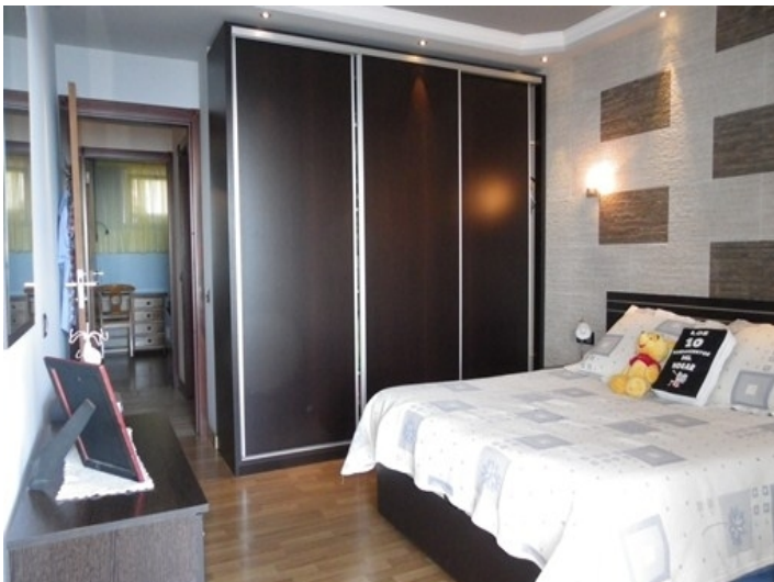
One of the bedrooms with double bed and large wardrobe