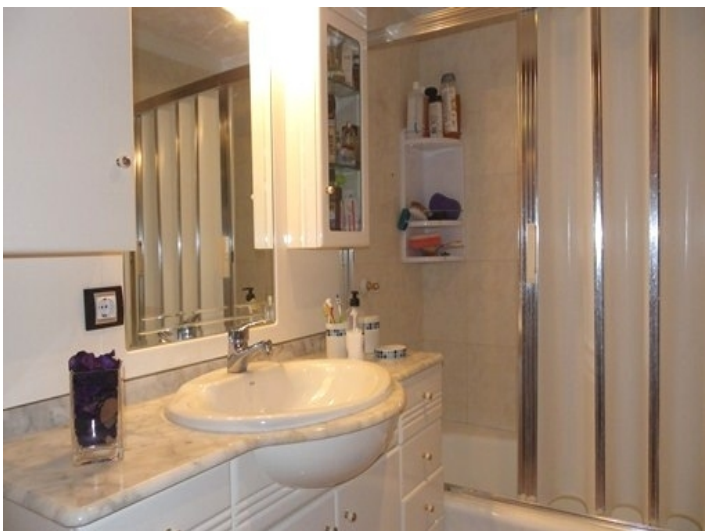
The bathroom with bathtub