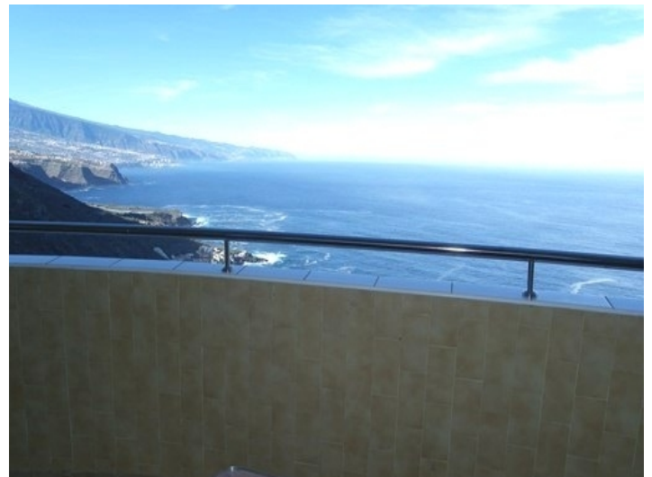
The stunning view from the balcony