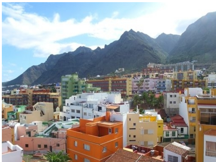
View of the Anaga mountains