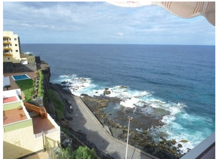
Overlooking the promenade and the waves