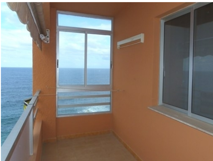
The Sunset Balcony