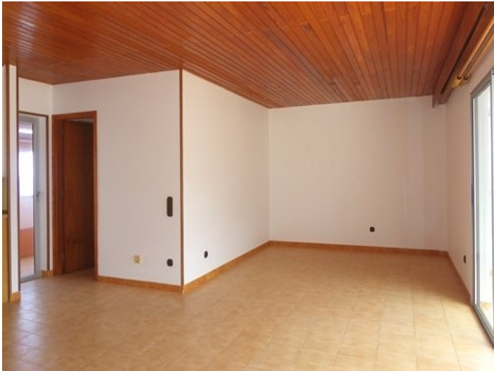
Spacious living room and the room at the West Terrace