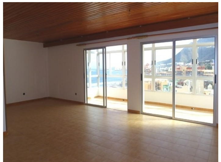
The sheltered terrace outside the living room