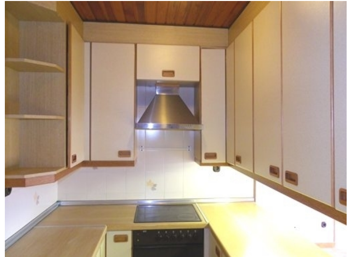
Kitchen with stove and range hood