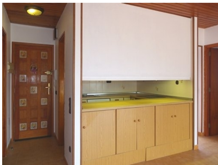
Entrance with bathroom and kitchen