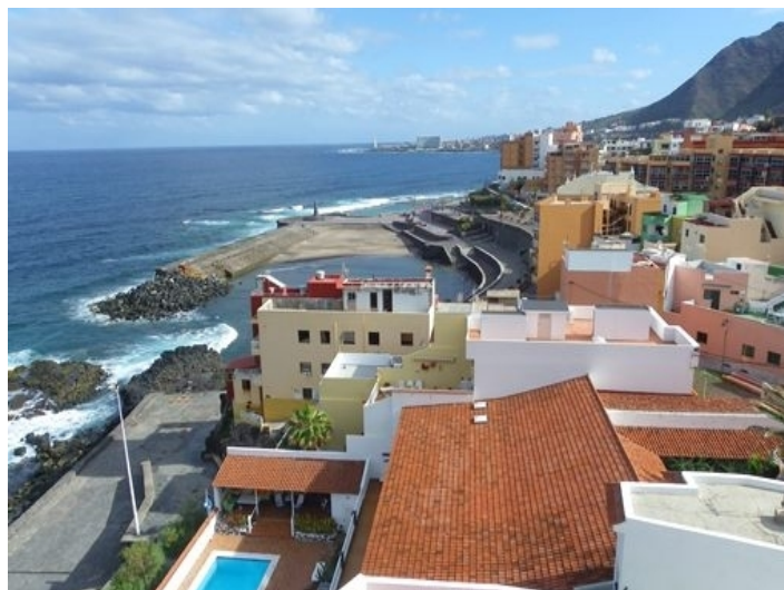
View over the small port to Punta del Hidalgo