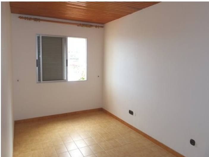
Bedroom for morning sun