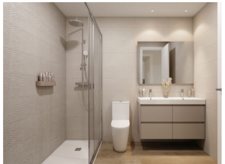
Badezimmer mit bodentiefer Dusche