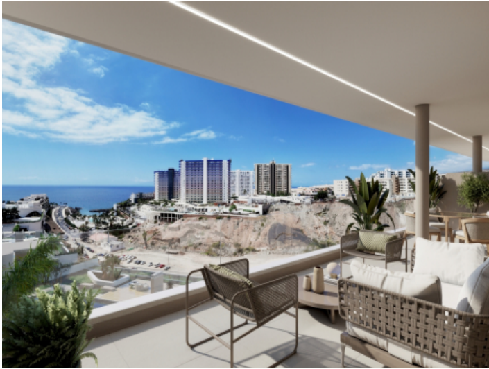
Terrasse mit Meerblick