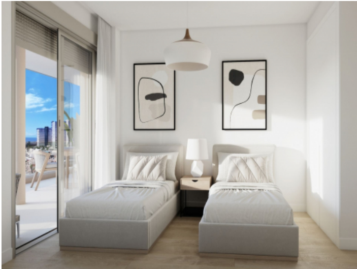
Ein weiteres Schlafzimmer