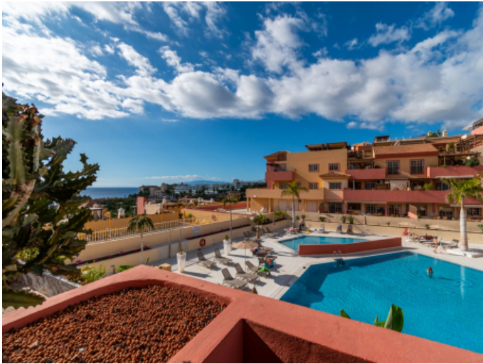
Wohnung, Costa Adeje