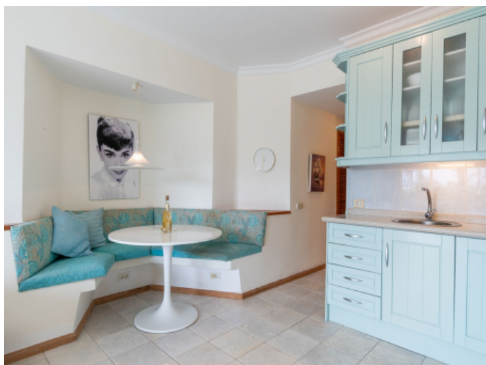
Küche und Essbereich