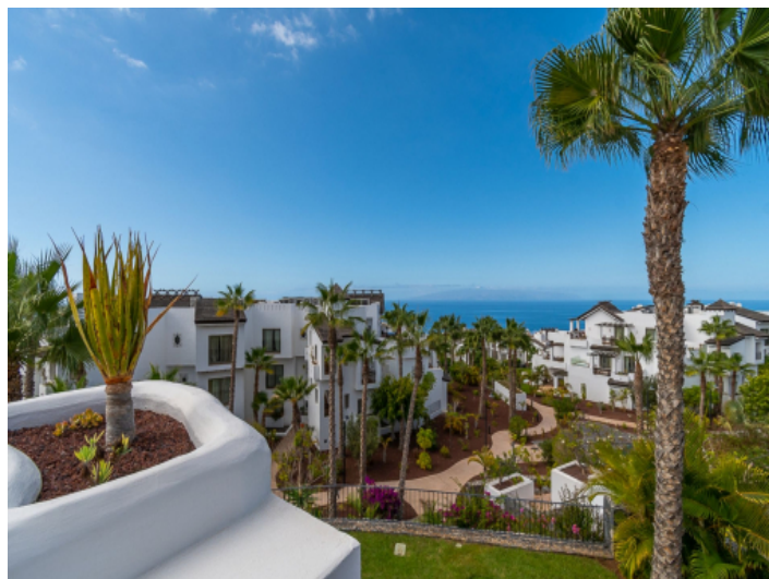
Blick auf den Atlantik