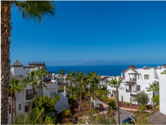
Blick auf den Atlantik