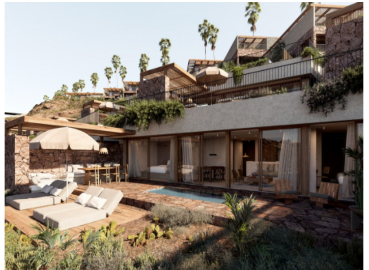
Wohnungen mit privatem Pool