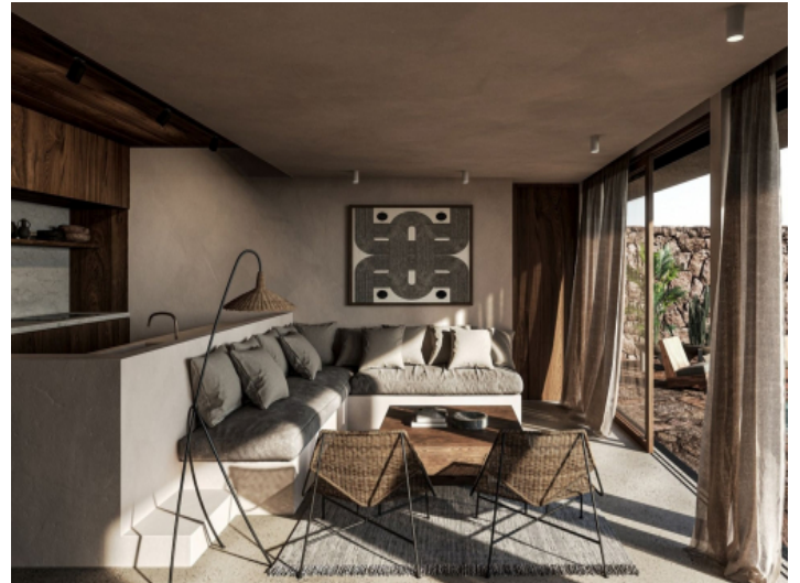
Eleganter Wohn- und Küchenbereich