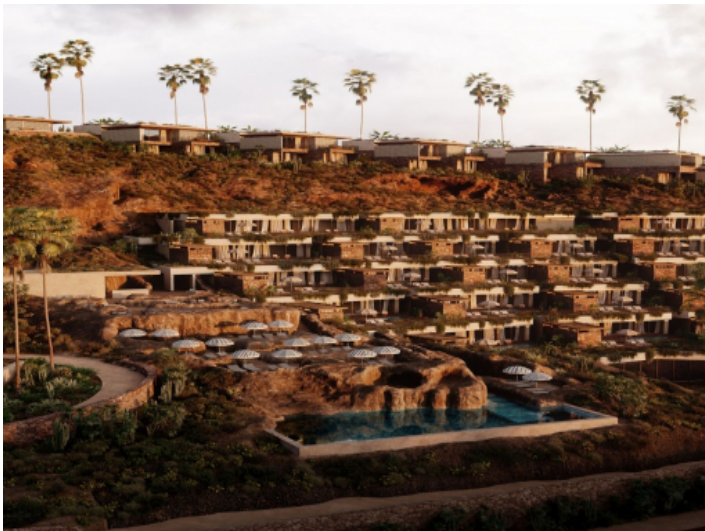
Ansicht auf diese exklusive Wohnanlage