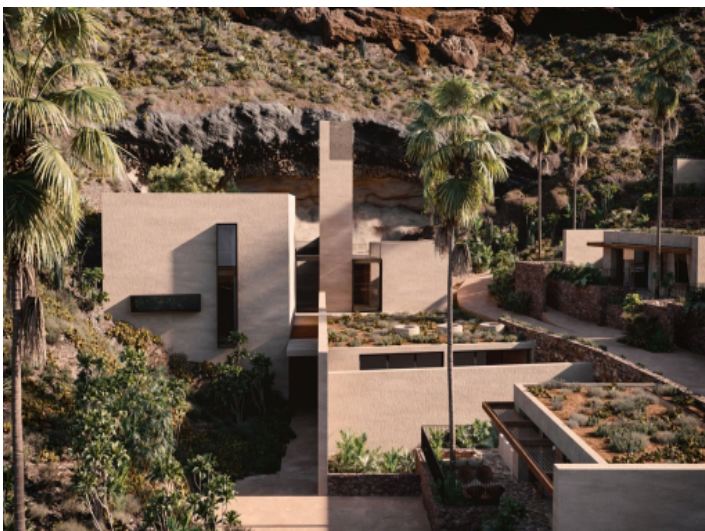
Architektur und Natur gehen ineinander über