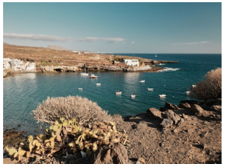
Der kleine Hafen