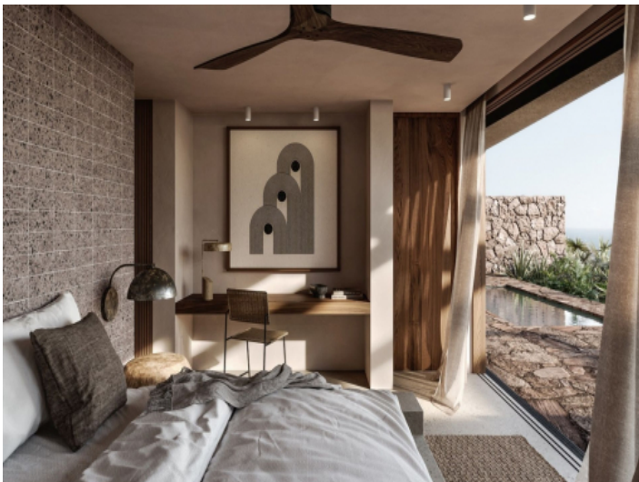
Gemütliches 2 Schlafzimmer Apartment