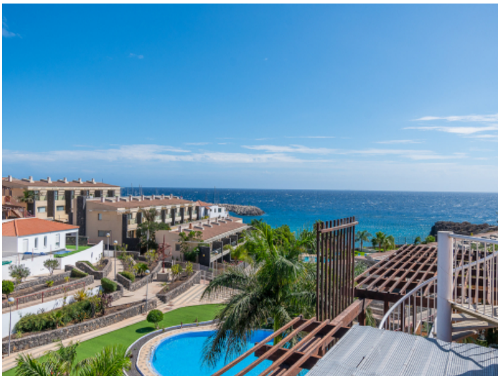
Meerblick von der Dachterrasse aus