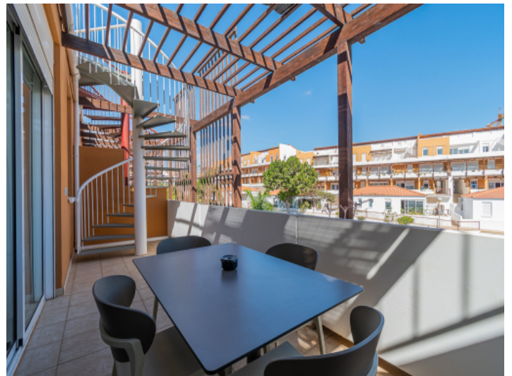
Terrasse mit Essbereich