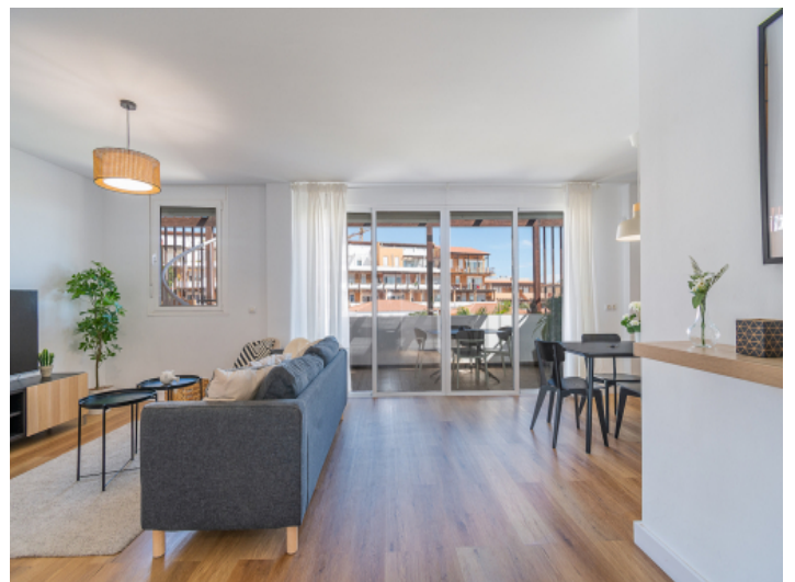
Wohnbereich mit Terrassenzugang