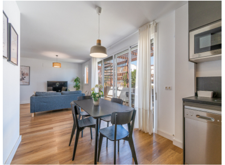
Weitere Ansicht des Essbereiches