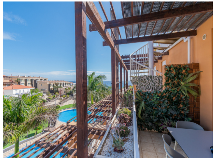
Terrasse mit Weitblick