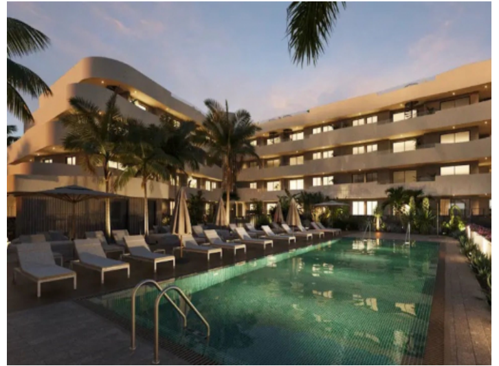
Außenansicht bei Dämmerung