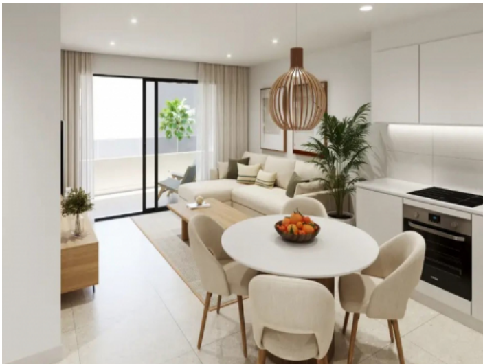
Essbereich und Küche