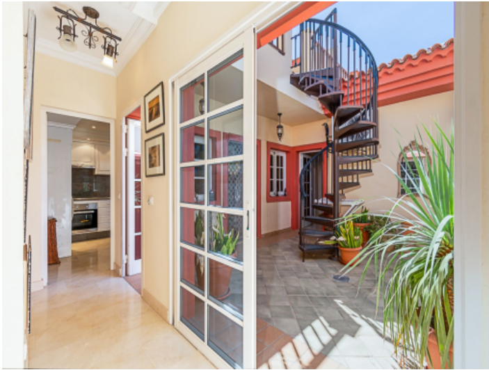
Zugang zur Terrasse