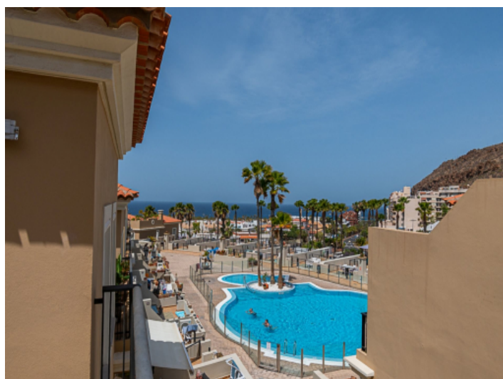
Pool- und Meerblick