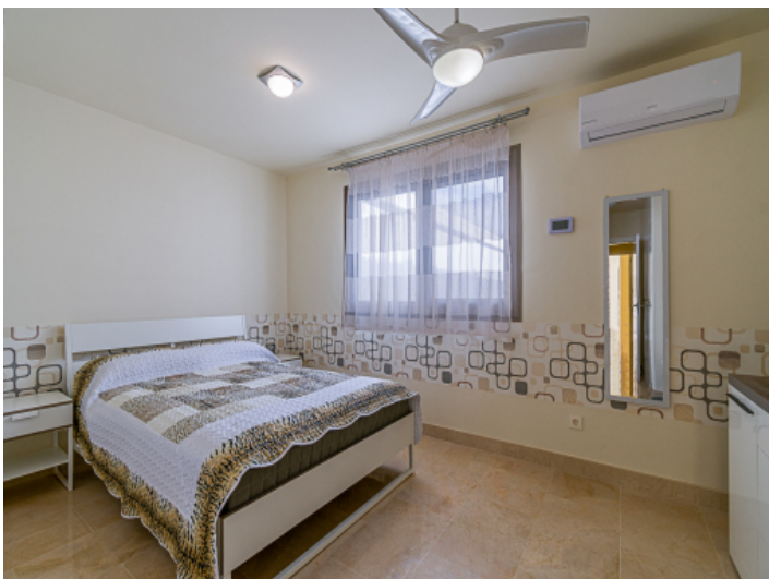
Schlafzimmer mit Klimaanlage