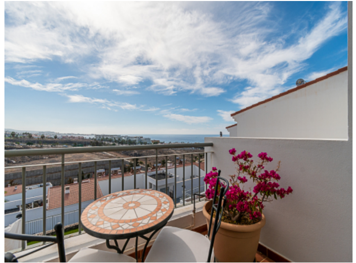
Eine von 3 Terrassen