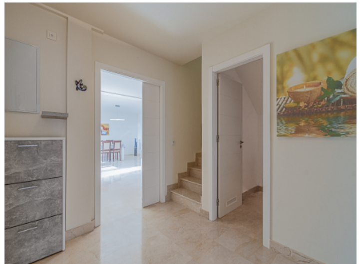
Eingangsbereich und Treppenaufgang