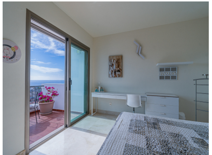
Schlafzimmer mit Meerblick