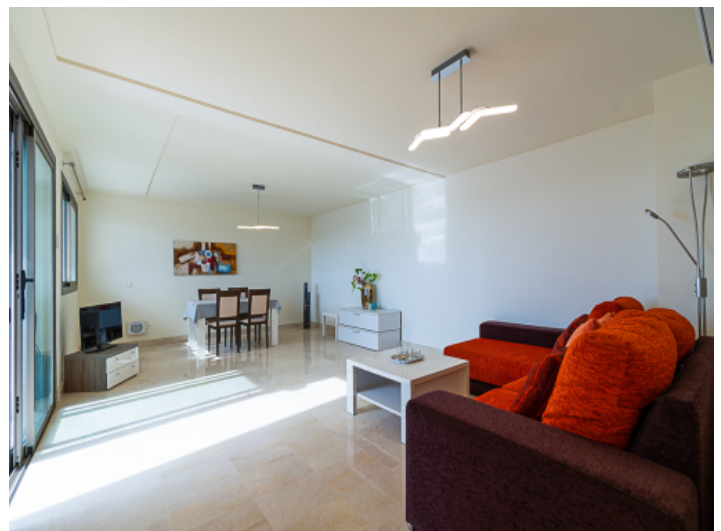
Lichtdurchfluteter Wohn und Essbereich