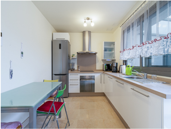
Küche mit viel Stauraum