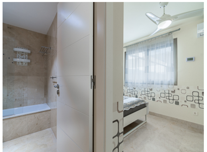
Schlafzimmer mit Bad en Suite