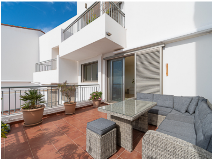
Großer Terrasse mit eleganter Sitzcke