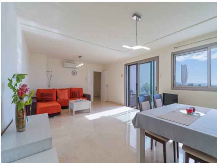
Wohn und Essbereich