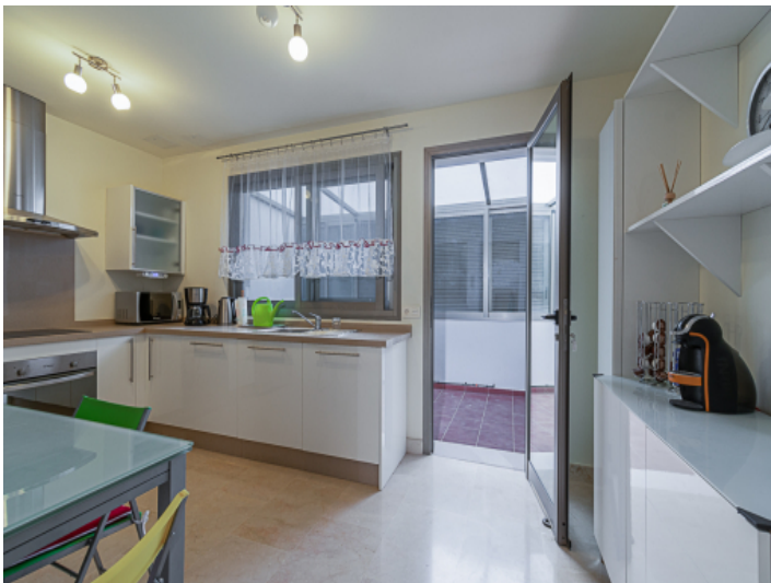
Küchen mit Zugang zu einer von 3 Terrassen