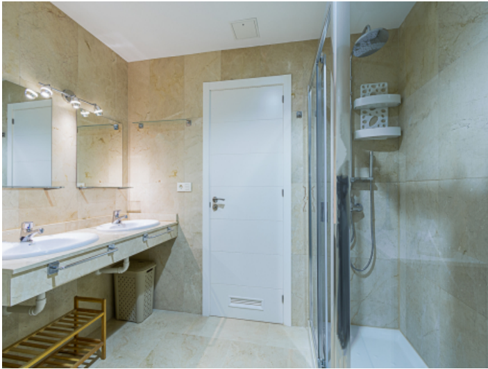
Das 2. Badezimmer