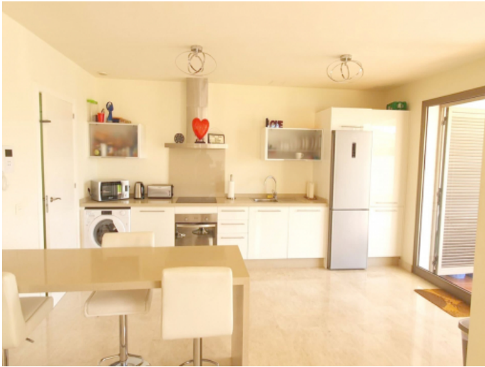
Küche mit Terrassenzugang