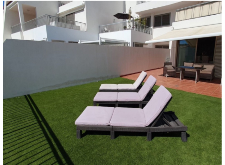
Teilweise überdachte Terrasse