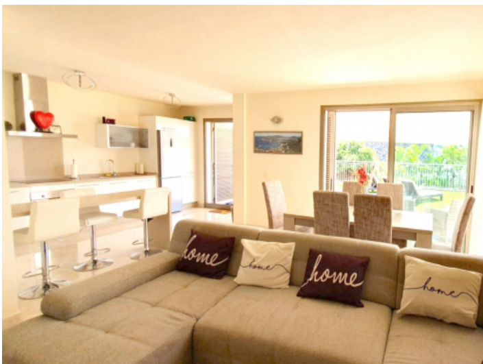
Offen gestalteter Wohnbereich