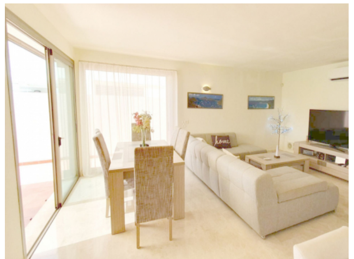
Heller Wohn- und Essbereich