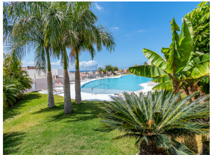
Von Natur umgebener Poolbereich