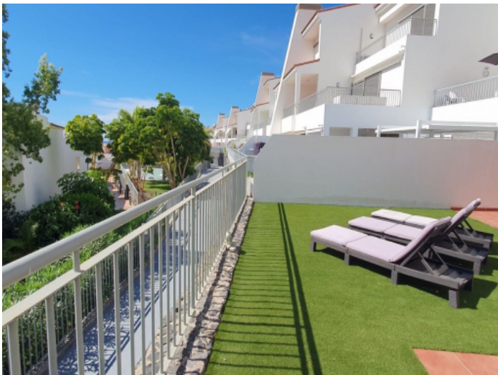
Sonnterrasse mit Liegen