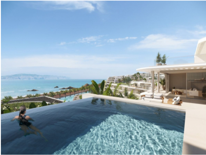
Pool auf der Dachterrasse