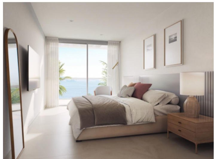
Schlafzimmer mit bodentiefen Fenstern