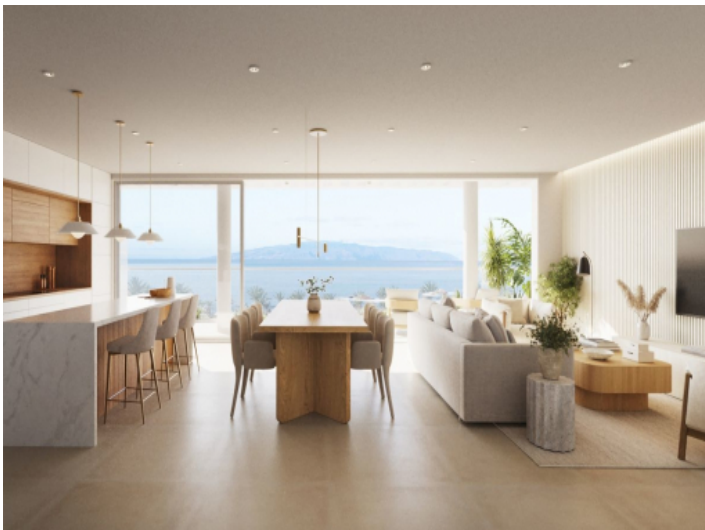
Blick in die Küche und den Essbereich