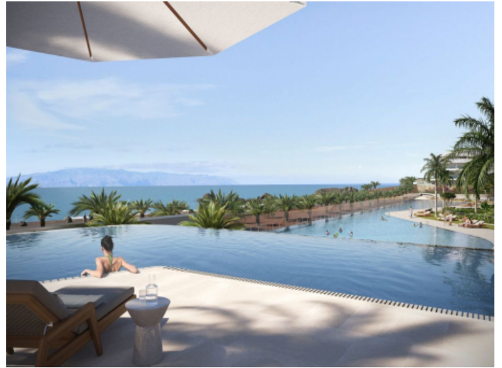
Beeindruckender Pool mit Meerblick