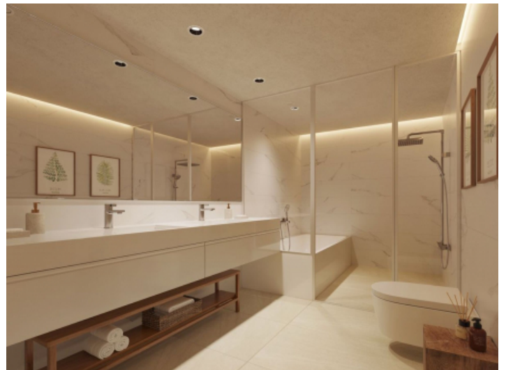
Eines von 2 Badezimmern