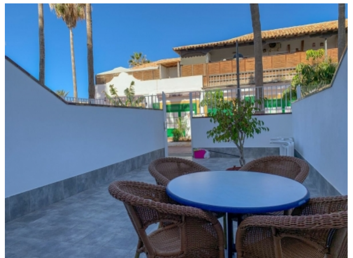
Essbereich auf der Terrasse