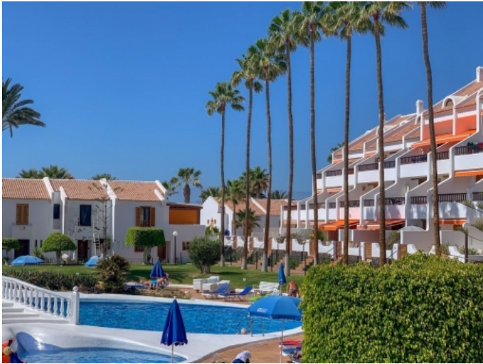
Ansicht des Wohnkomplexes