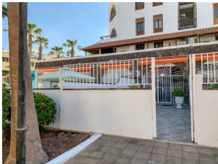
Zugang zur Wohnung