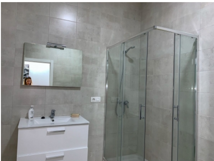
Modernes Badezimmer mit Dusche