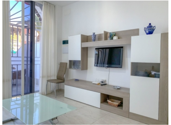
Wohnbereich mit Terrassenzugang