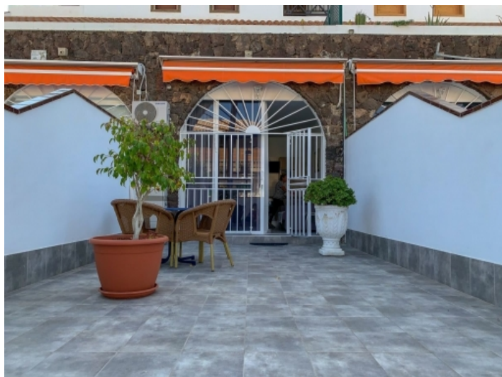
Außenansicht der Wohnung