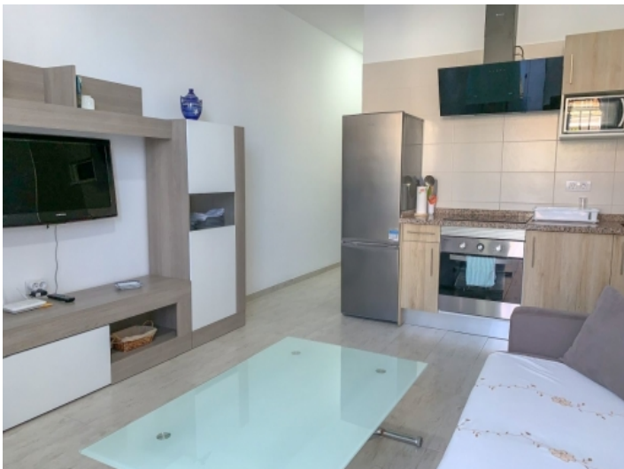
Offene Wohnstube und Küche