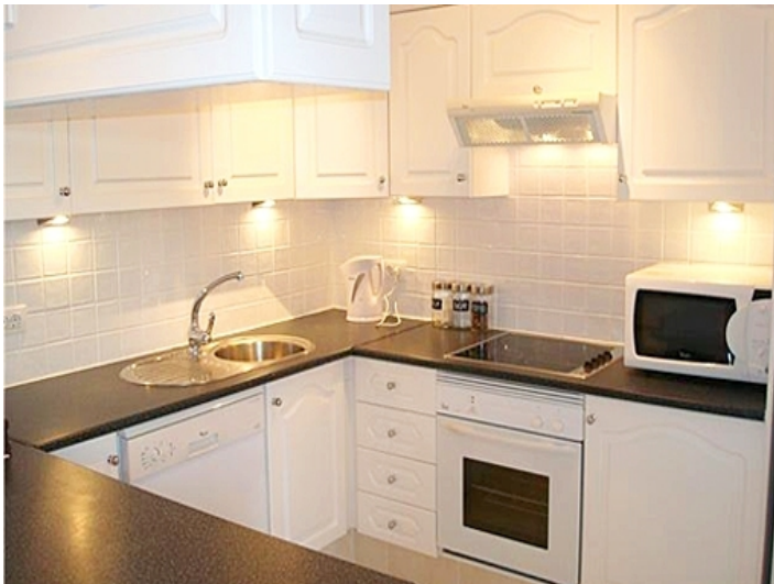
kueche-golf del sur-wohnung