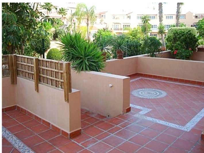
golf del sur-terrasse-wohnung