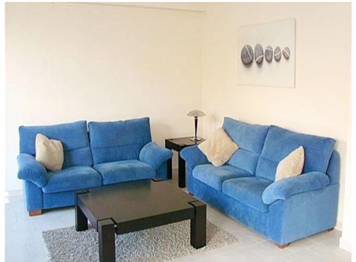
wohzimmer-golf del sur-wohnung