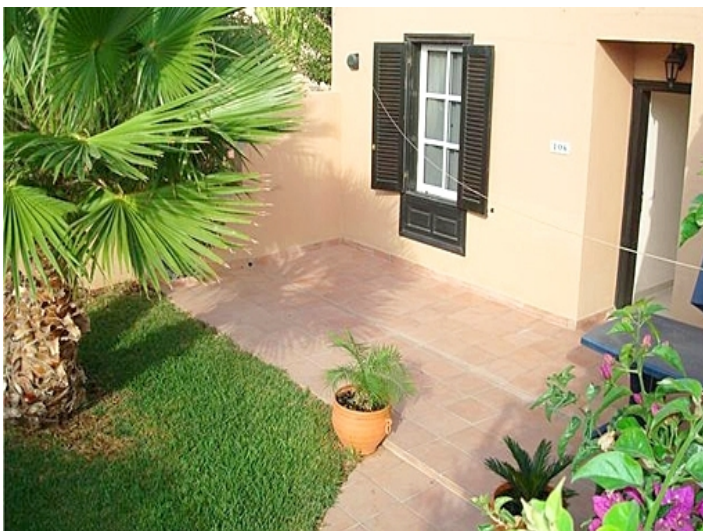
wohnung-eingang-golf del sur