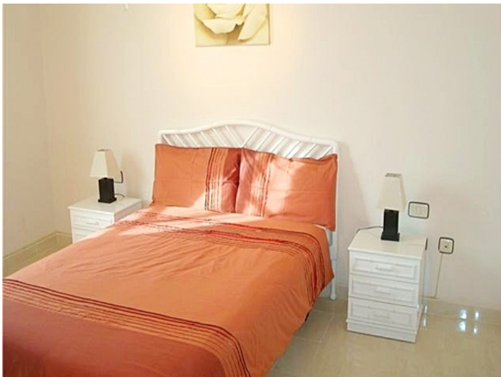
golf del sur-schlafzimmer-wohnung