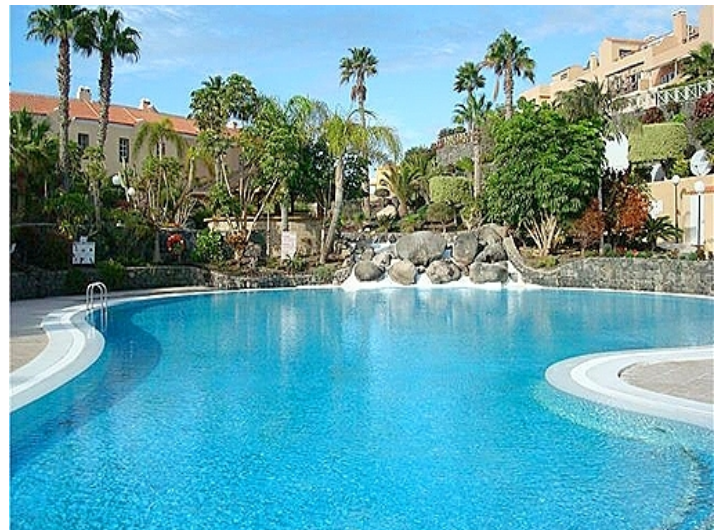
pool-wohnung-golf del sur