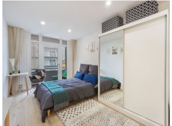
Offener Wohn- und Schlafbereich mit Balkon