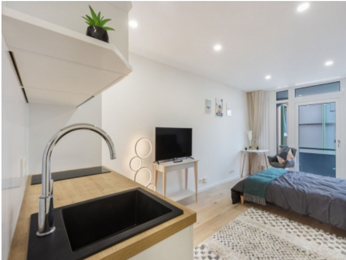
Offener Wohn- und Schlafbereich mit Balkon