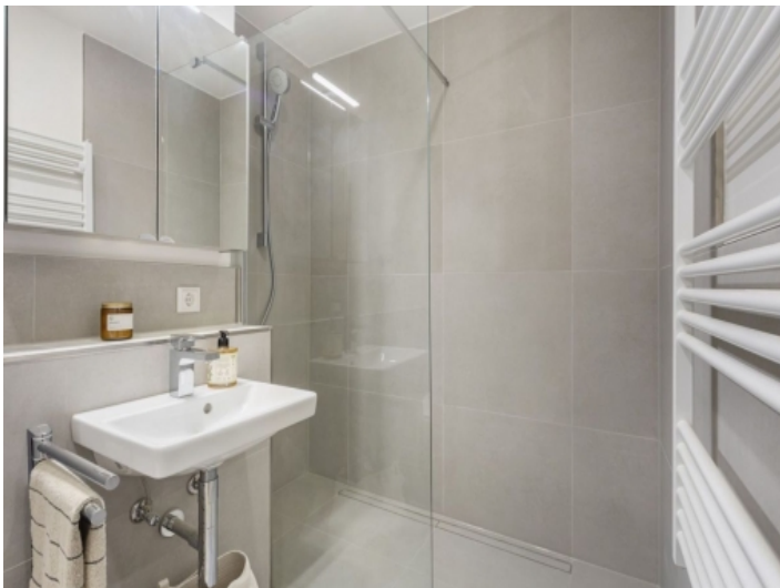
Elegantes Badezimmer mit Ebenerdiger Dusche