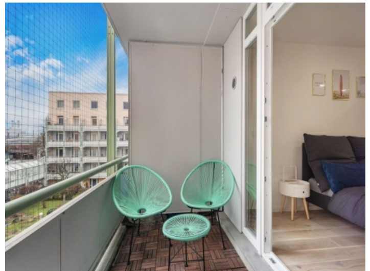
Balkon mit Blick zum Innenhof