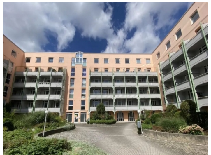
Außenansicht des Wohnhauses