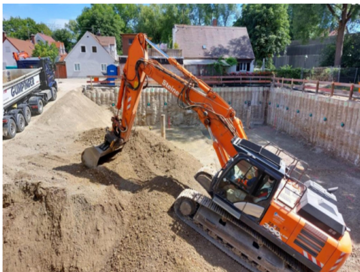
Bau hat begonnen