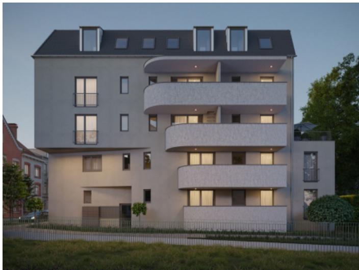
Moderne Neubauwohnungen in Augsburg