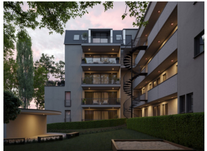
Moderne Neubauwohnungen in Augsburg