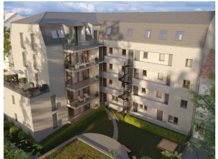
Moderne Neubauwohnungen in Augsburg