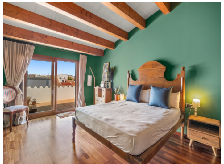
Hauptschlafzimmer mit Terrassenzugang