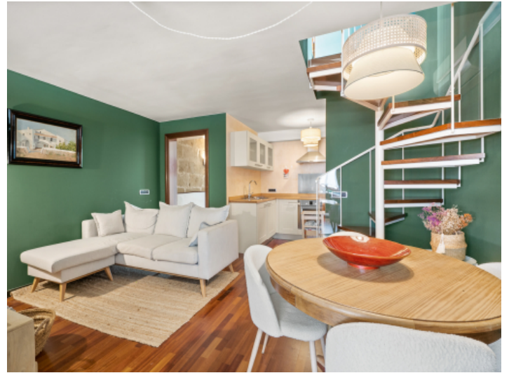
Schöner Wohn-Ess-und Küchenbereich