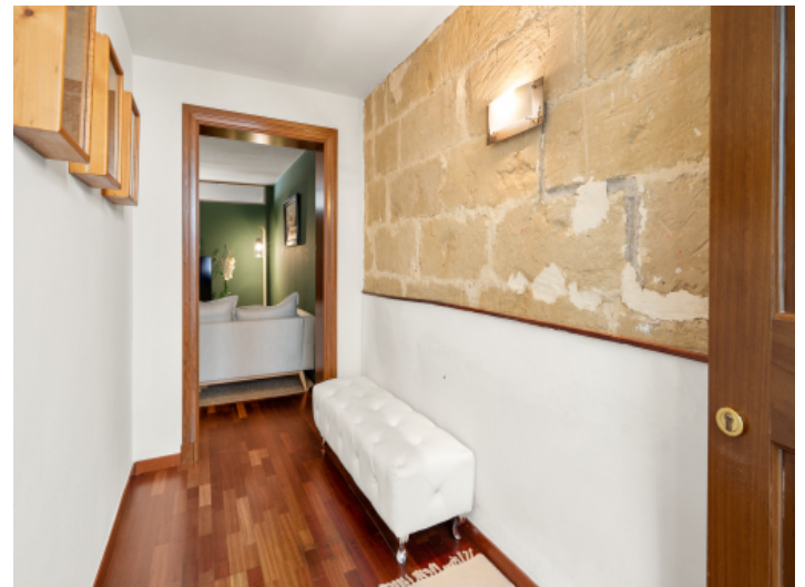
Zugang zur Wohnung mit Sandsteinwand