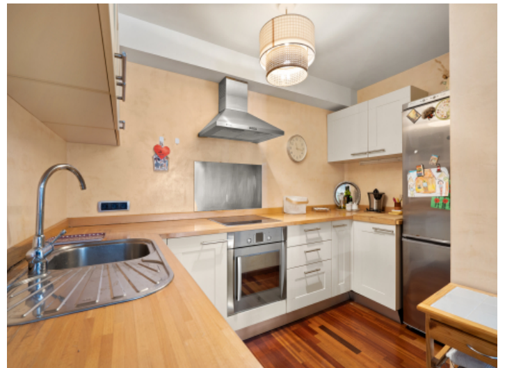
Moderne, offene Küche