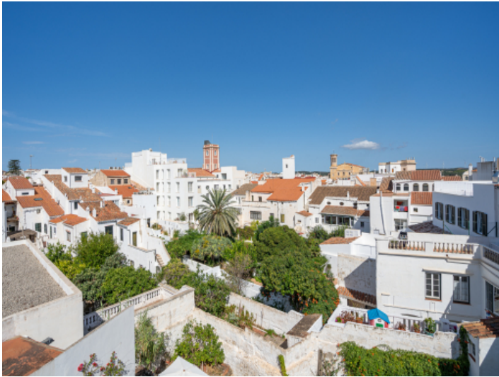
Wundervoller Ausblick über die Altstadt von Mahon