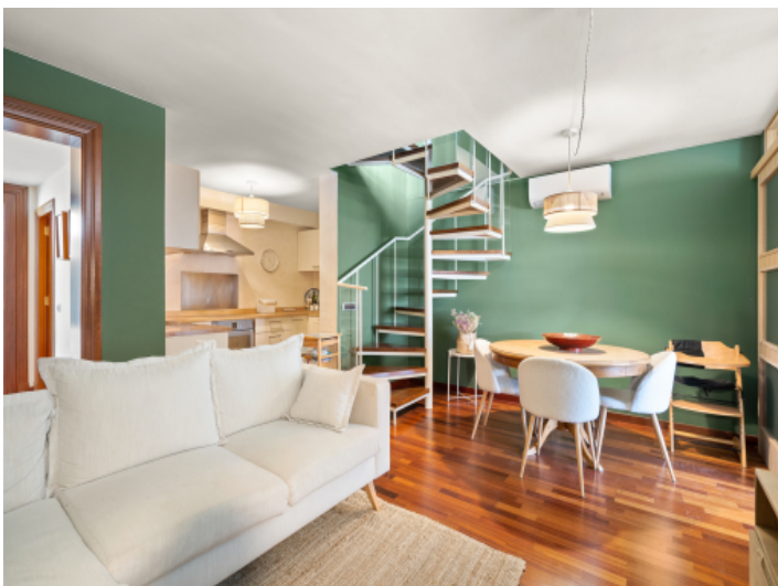
Eine Wendeltreppe führt nach oben