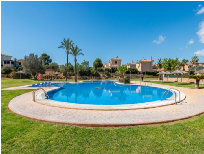
Pool mit Liegewiese