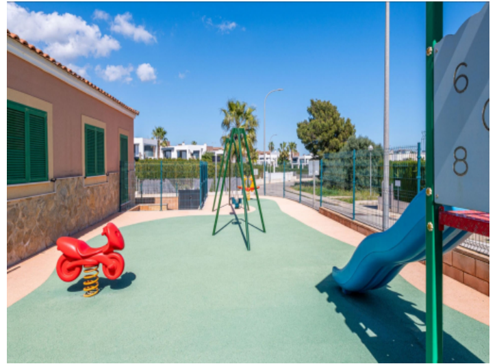
Kinderspielplatz im Gemeinschaftsbereich