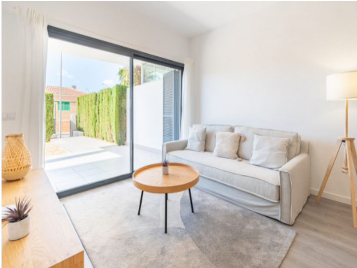
Wohnbereich mit Zugang zur Terrasse