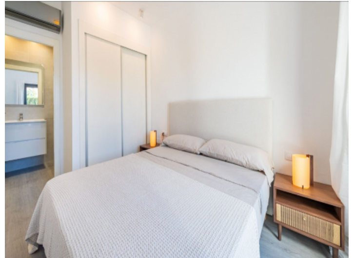
Doppelschlafzimmer mit Bad en Suite