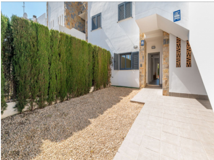
Eingang zur Wohnung