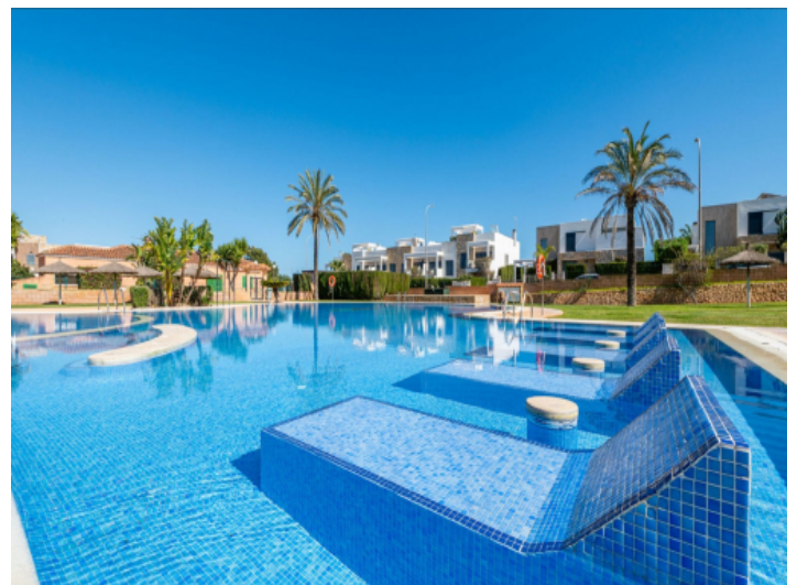
Gemeinschaftspool mit Liegewiese