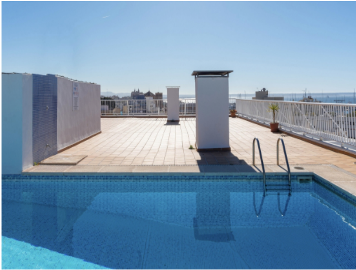
Gemeinschaftsdachterrasse mit Pool