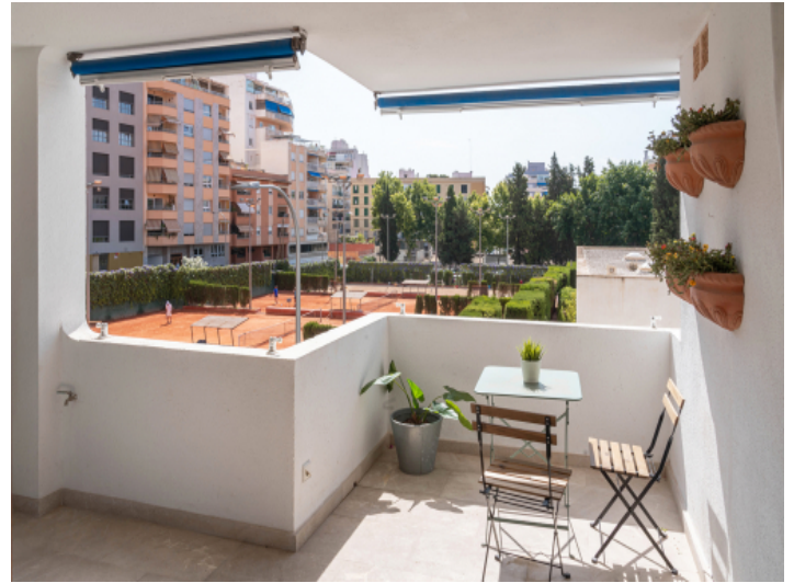
Überdachter Balkon mit Blick auf den Tennisplatz