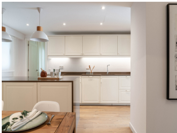
Offene moderne Küche