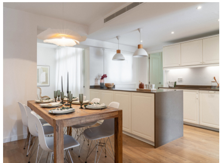
Offene Küche mit Essbereich