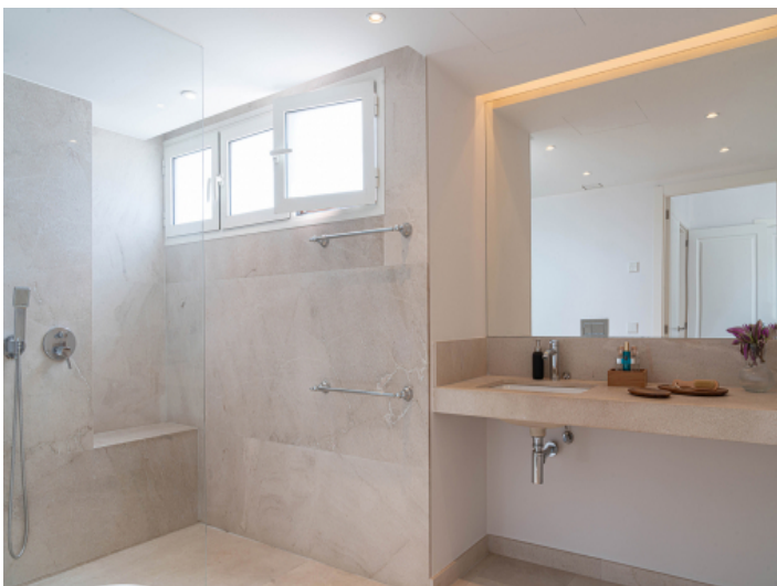
Eines der 3 Badezimmer