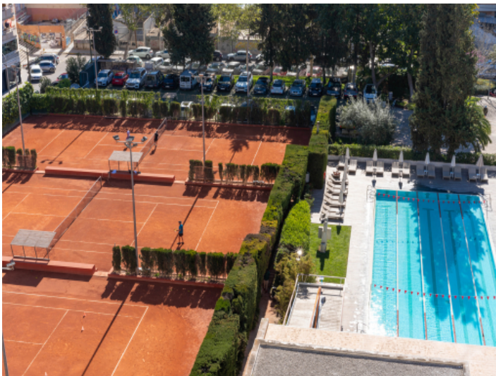
Blick auf den Tennisplatz