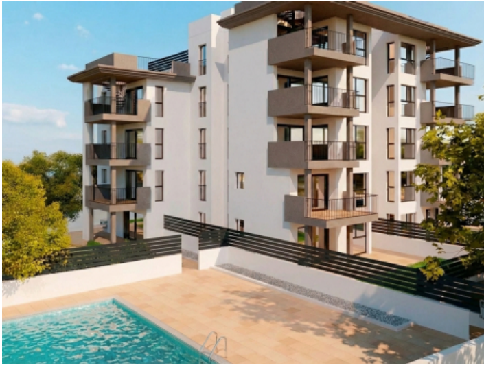
Neubauwohnungen Cala Miller