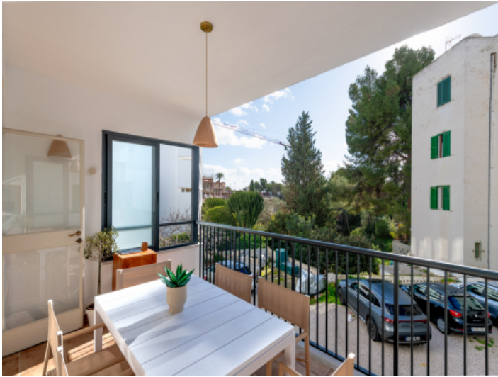
Großzügige überdachte Terrasse