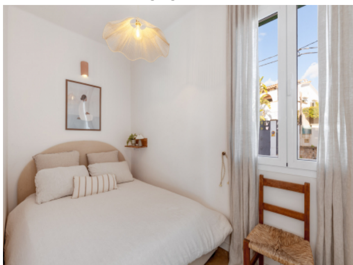
Eines der zwei Schlafzimmer