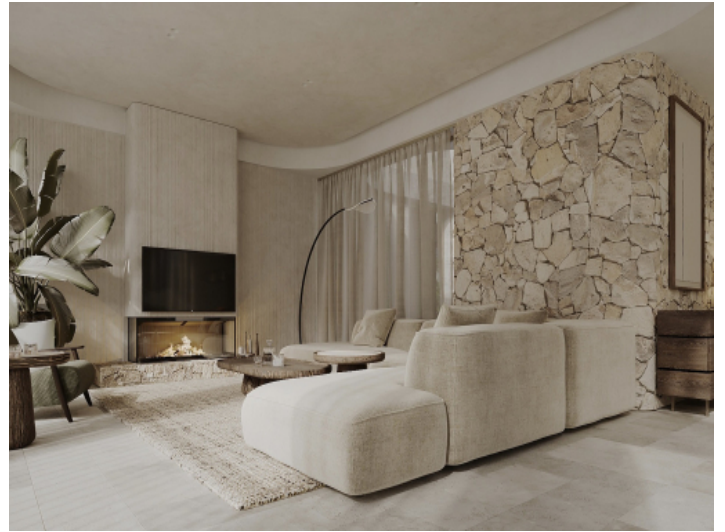
Wohnbereich mit Gaskamin