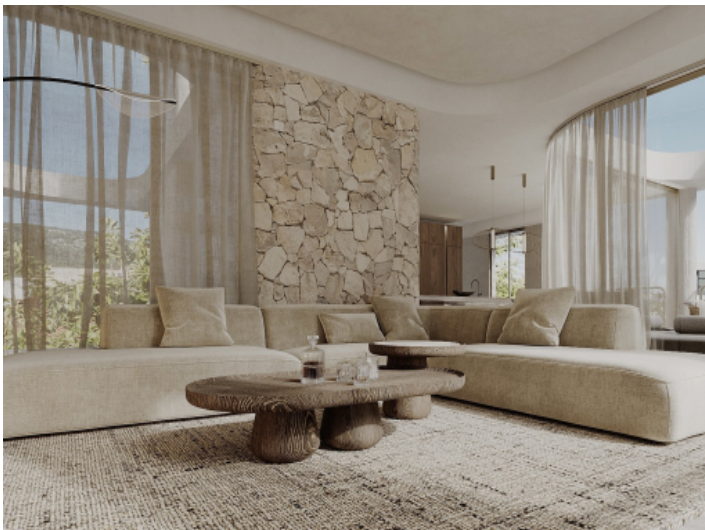
Wohn und Essbereich