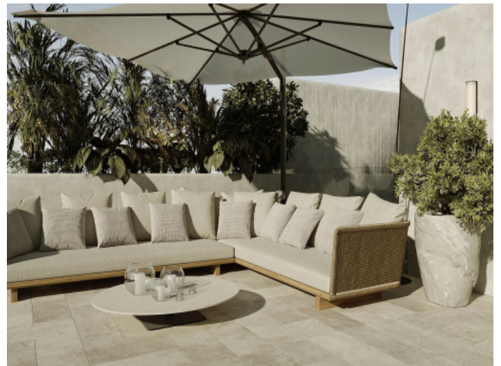
Lounge-Bereich auf der Dachterrasse