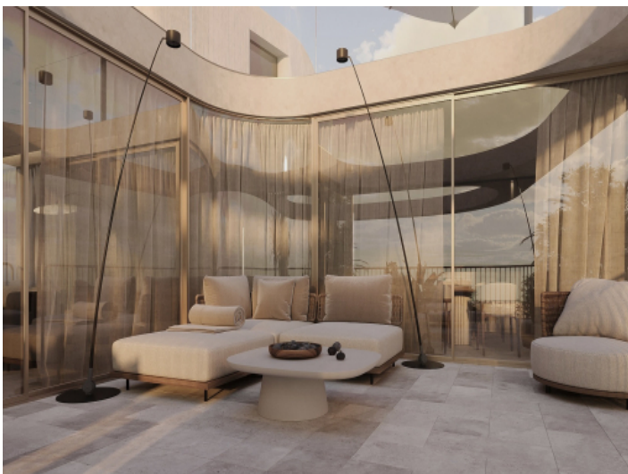
Terrasse beim Wohnbereich