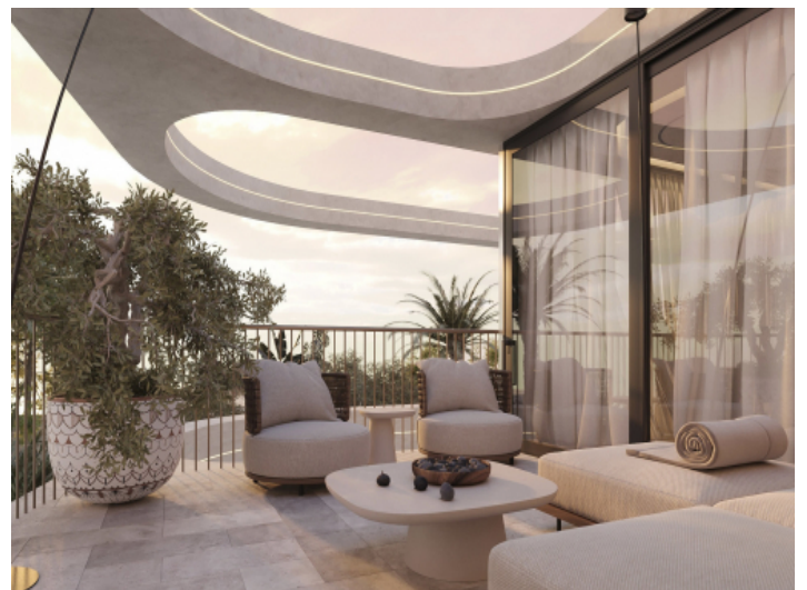
Terrasse auf der Wohnebene