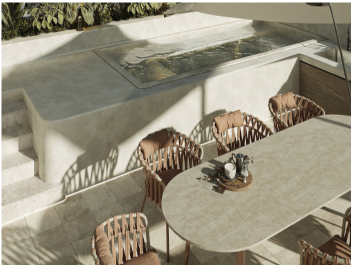
Essbereich auf der Dachterrasse