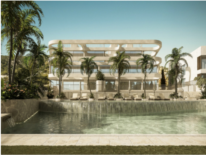
Poolbereich und Fassade