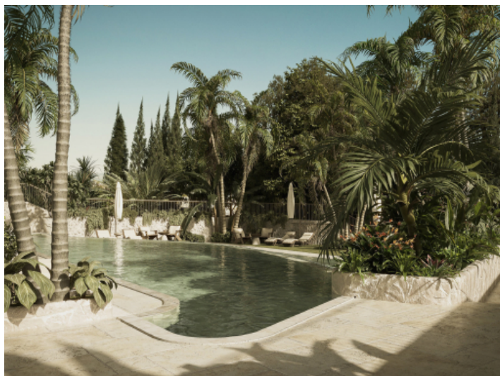
Pool mit tropischem Garten