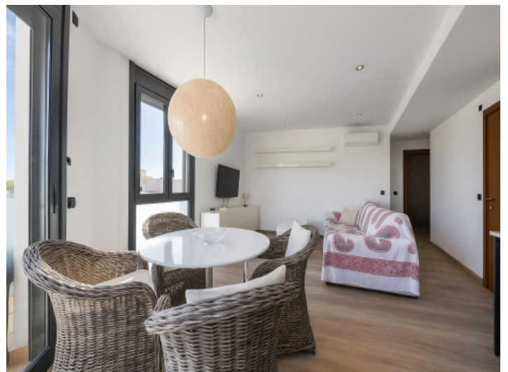
Wohnbereich und Essbereich