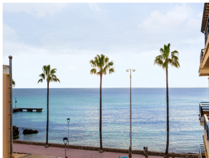
Wenige Schritte bis zum Meer