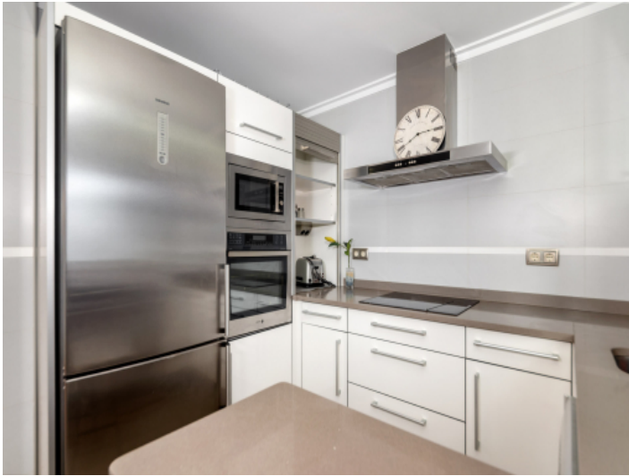
Weitere Ansicht der Küche