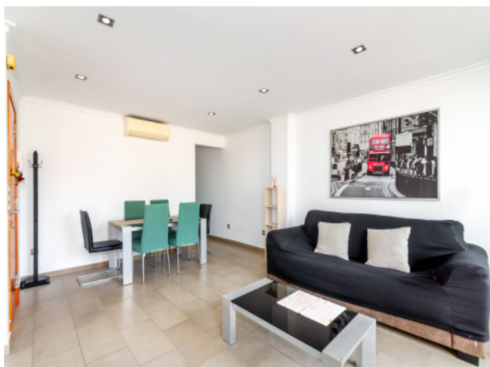
Offen gestalteter Wohn-/Essbereich