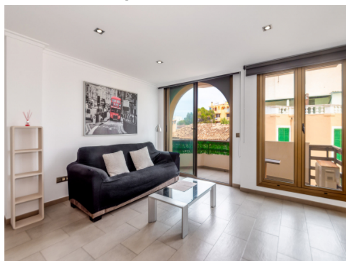
Wohnbereich mit Balkonzugang