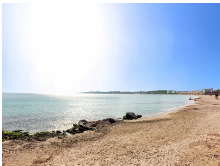
Strand in der Nähe