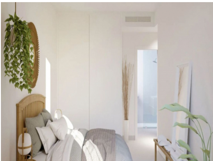
eines von 3 Schlafzimmern