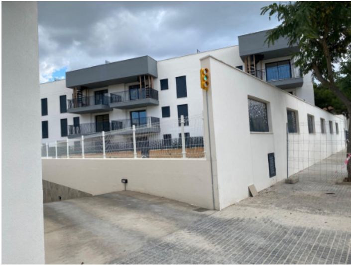
Ansicht auf das Mehrfamilienhaus