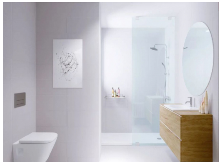
Wohnung mit 2 Badezimmern