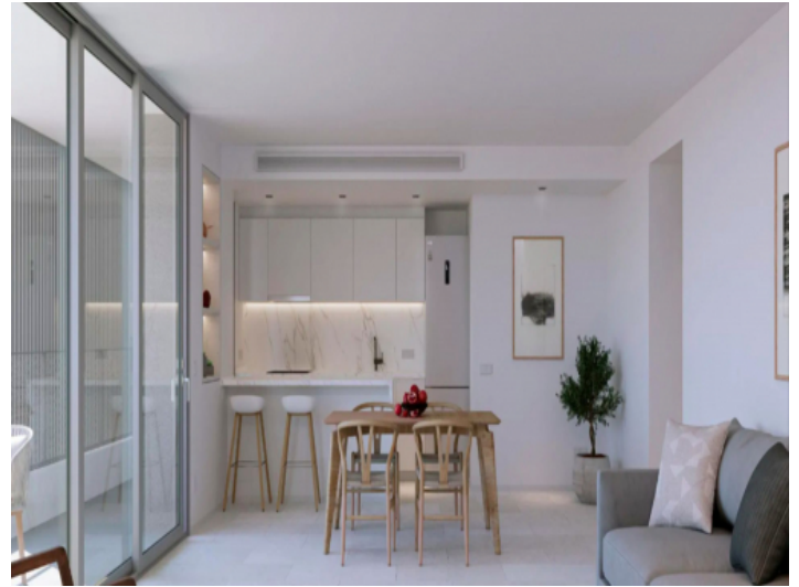
Wohnung mit 2 Schlafzimmern und 2 Badzimmern