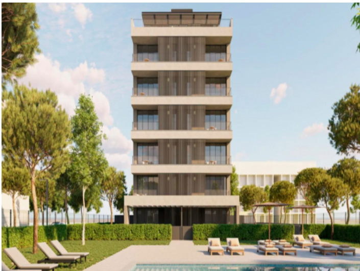
Neues Wohnprojekt in Cala Millor – Perfekt für Strandliebhaber