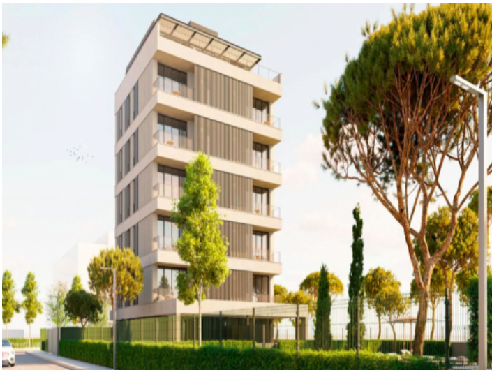
Ansicht auf das Gebäude