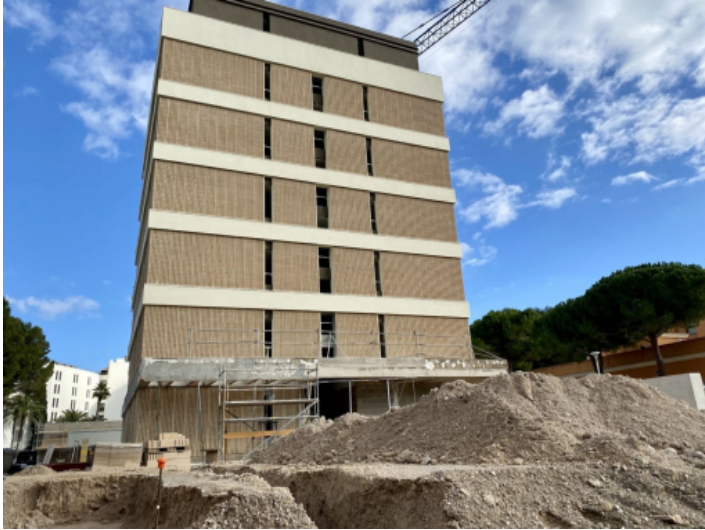
Wohngebäude im Bau