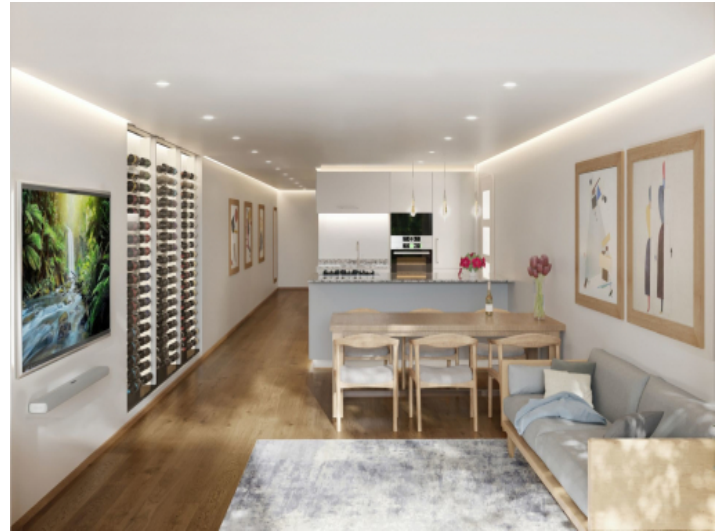
Heller Wohn- und Essbereich