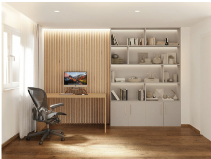
büro oder Schlafzimmer