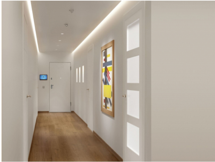
Eingangsbereich und Flur