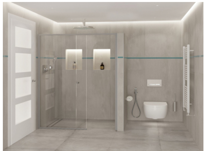
Das 2. Badezimmer