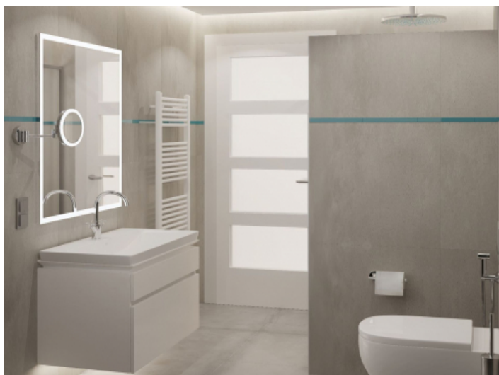
Badezimmer mit bodentiefer Dusche