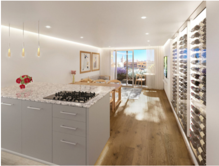
Helle Wohnung in Toplage