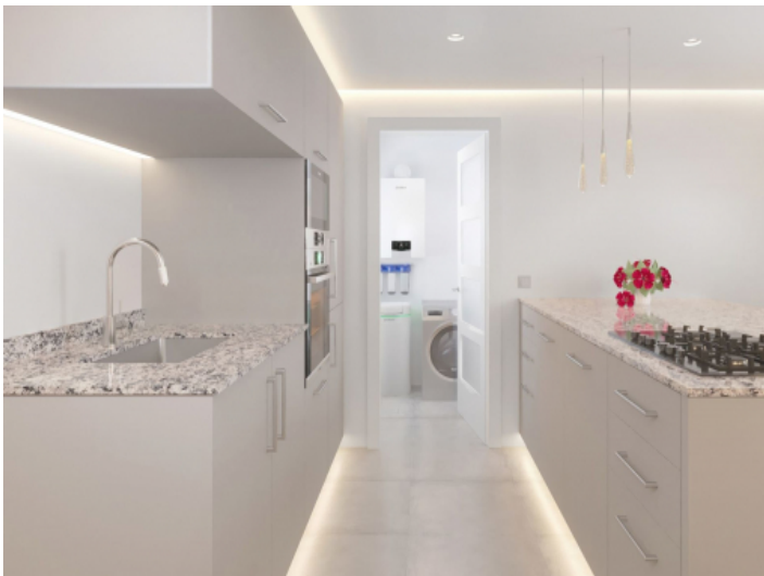
Moderne Küche und Hauswirtschaftsraum o