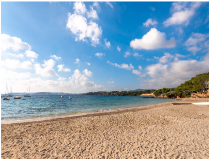
Strand in der Nähe