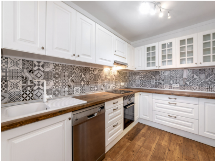
Sehr gepflegte Küche