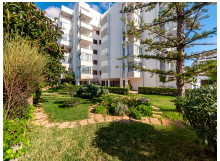
Außenansicht des Gebäudes