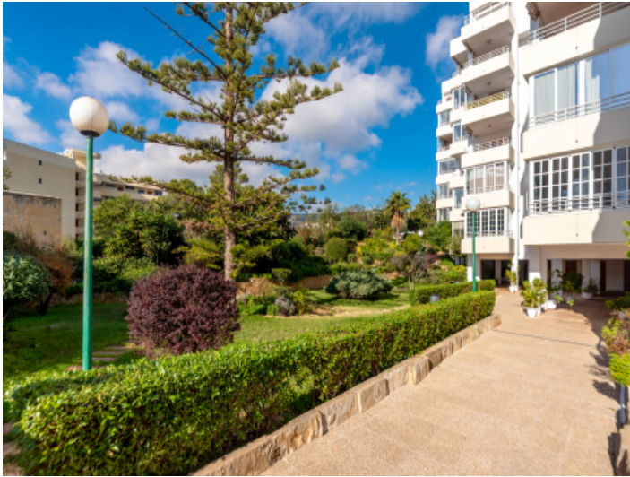
Außenansicht des Gebäudes