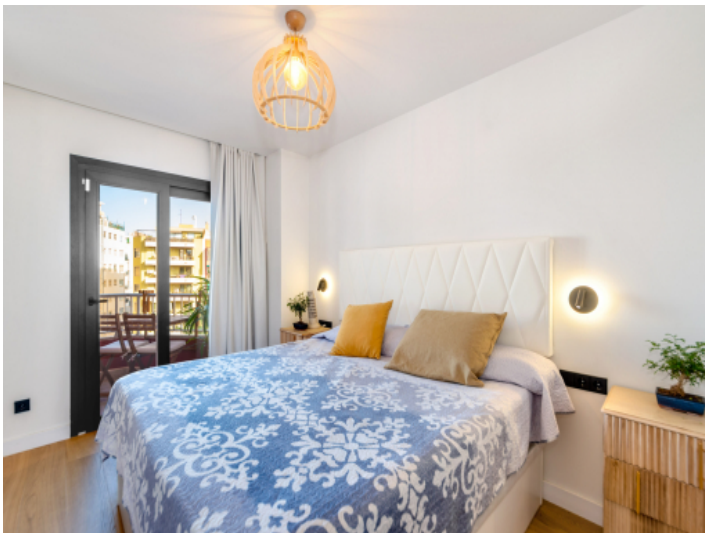
Eines von 2 Schlafzimmern