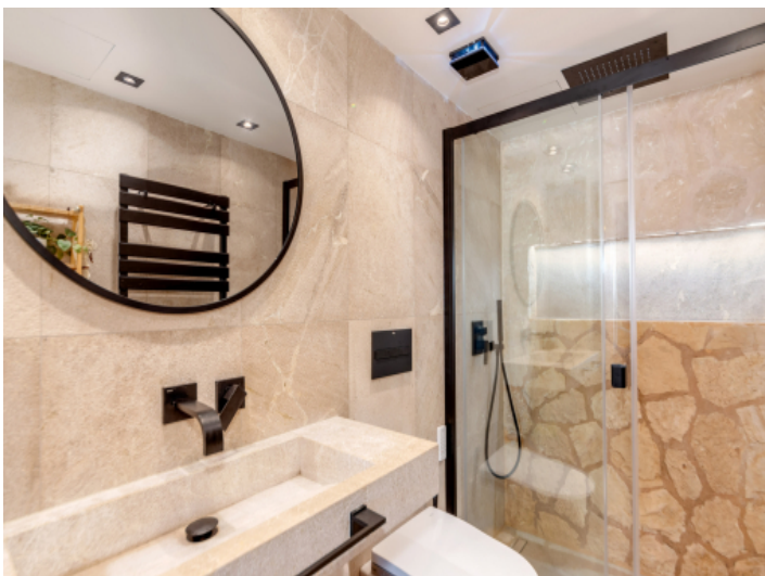
Badezimmer en Suite