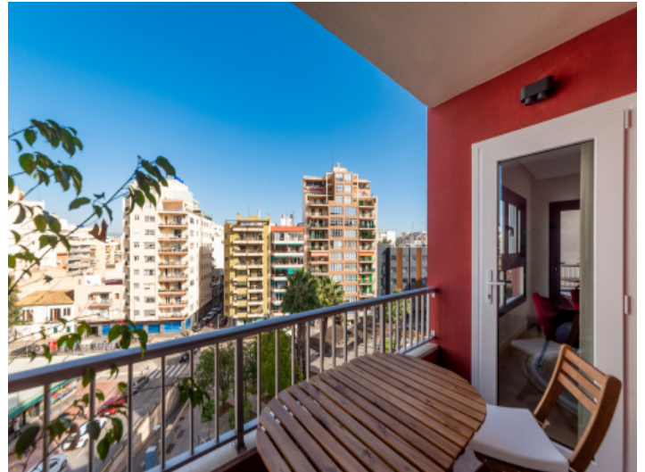
Mit Balkon und im Stadtzentrum