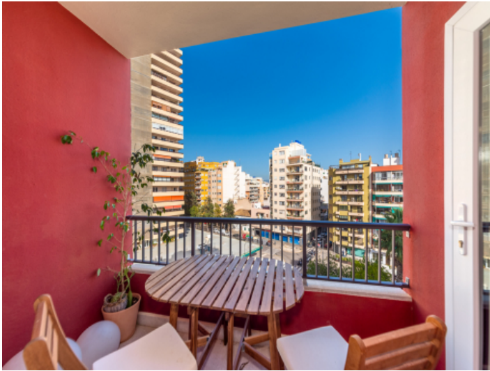
Stadtwohnung mit Balkon