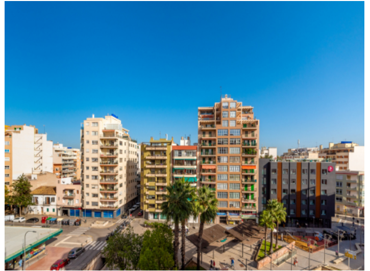
Aussicht auf die Umgebung