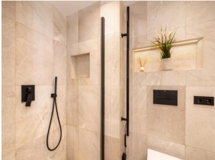
Ein weiteres Badezimmer