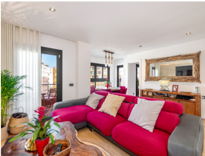
Offener Wohn- und Essbereich