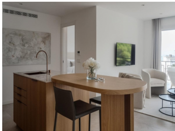
Offener Wohn- Essbereich