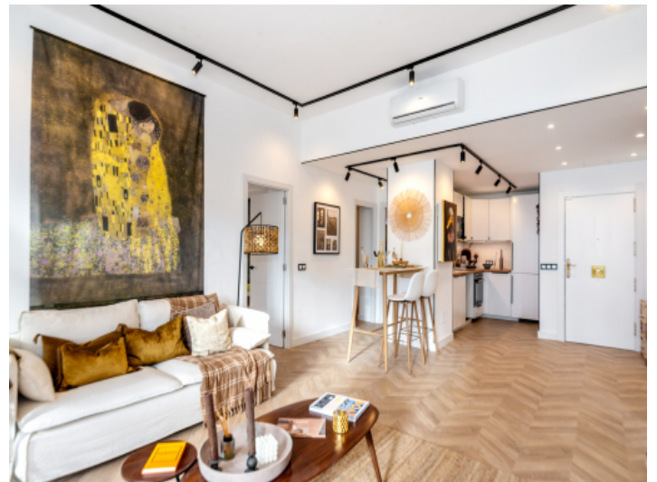
Wohn und Küchenbereich