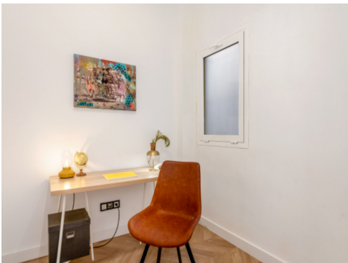
Arbeitszimmer oder Schlafzimmer