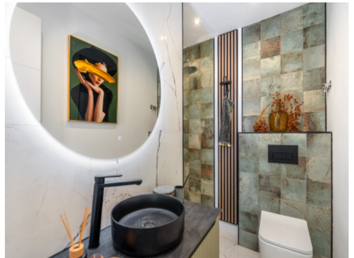
Das 2. Badezimmer